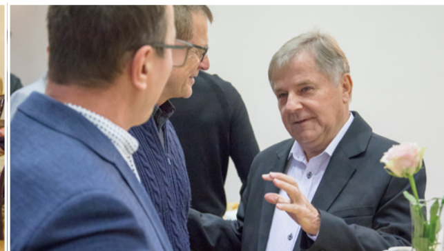
Przedsiębiorcy mogli zgłosić swoje uwagi i spostrzeżenia