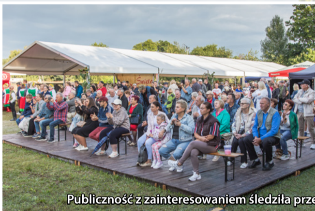
Publiczność z zainteresowaniem śledziła przebieg wydarzeń i występy artystyczne na scenie