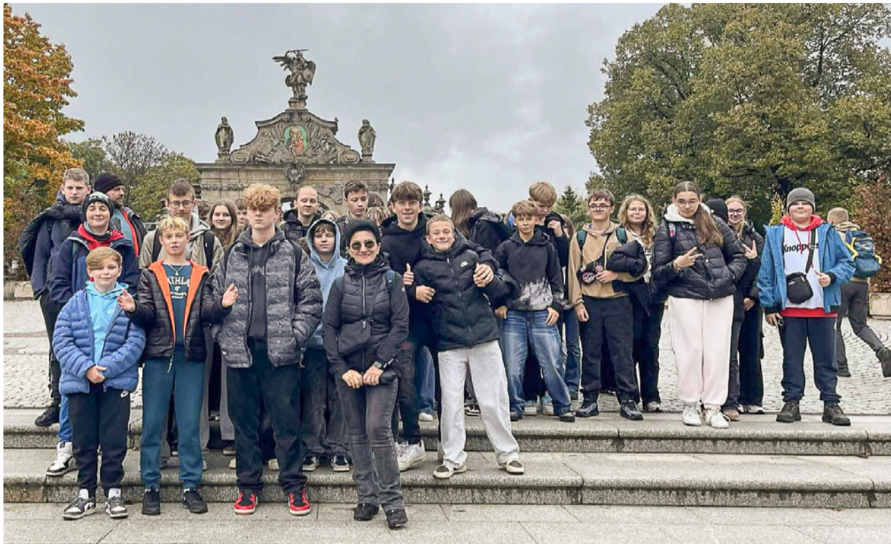
Wyjazd do Częstochowy to wieloletnia tradycja

Uczniowie z Twardogóry uczestniczyli w uroczystej mszy świętej na Jasnej Górze, podczas której wspólnie z rówieśnikami i nauczycielami z innych szkół modlili się o pokój, dobro i jedność w duchu nauczania Jana Pawła II. Spotkanie było również okazją do integracji, wspólnego śpiewu oraz wymiany doświadczeń między szkołami, które łączy wspólny patron.