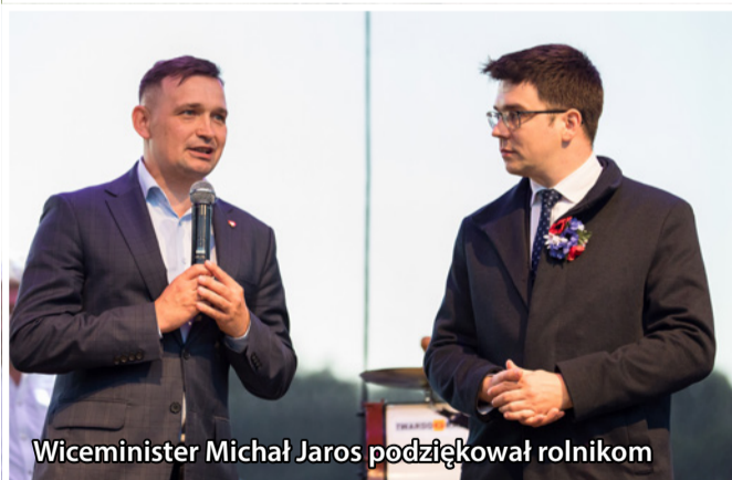
Wiceminister Michał Jaros podziękował rolnikom