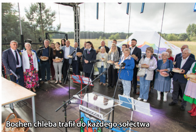
Bochen chleba trafił do każdego sołectwa