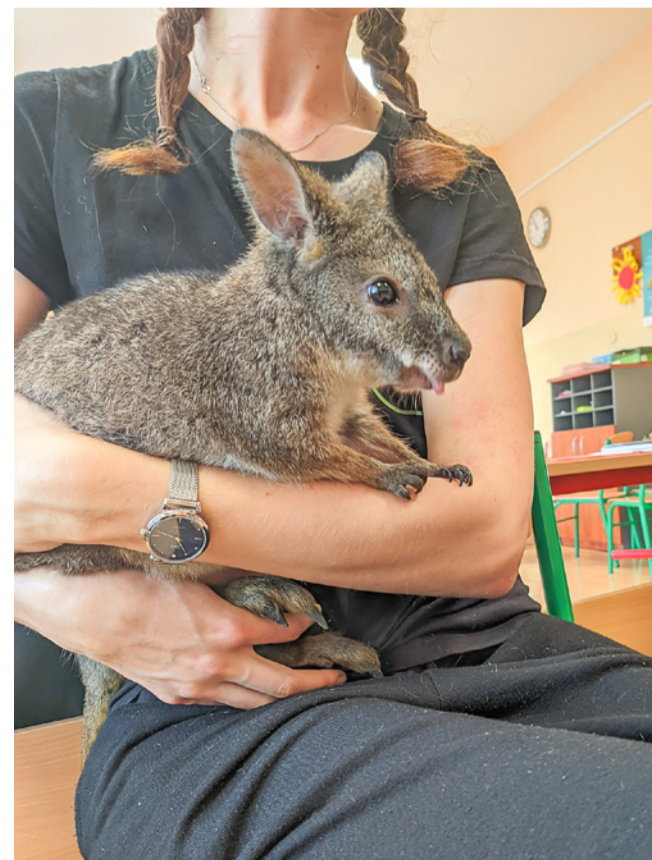
Z Australii do Goszcza

W SP w Goszczu odbyła się niezwykła lekcja dla najmłodszych uczniów. Dzieci z klas młodszych miały okazję spotkać prawdziwego kangura. Podczas spotkania uczniowie dowiedzieli się wielu ciekawostek o życiu kangurów, ich zwyczajach i środowisku naturalnym. Mogli obserwować zachowanie zwierzęcia, zadać pytania prowadzącemu i dowiedzieć się, jak opiekować się egzotycznymi gatunkami. Niecodzienna lekcja okazała się nie tylko wspaniałą przygodą, ale również praktyczną lekcją przyrody, rozwijającą ciekawość i wrażliwość na otaczający świat.