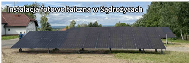
Instalacja fotowoltaiczna w Sądroźcach