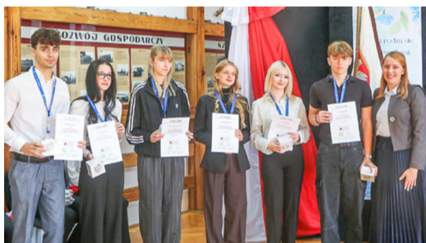
"Promienni Wizjonerzy" z dyplomami i nagrodami