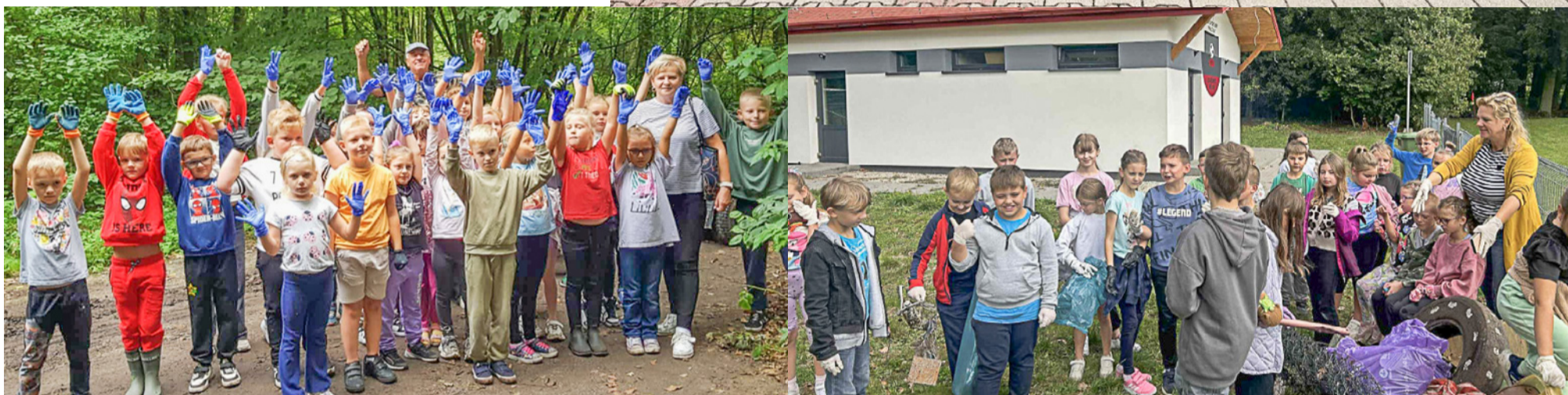
Szkoły zostały nagrodzone bonami na zakup materiałów edukacyjnych