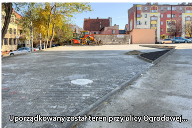
Uporzędkowany został teren przy ulicy Ogrodowej...