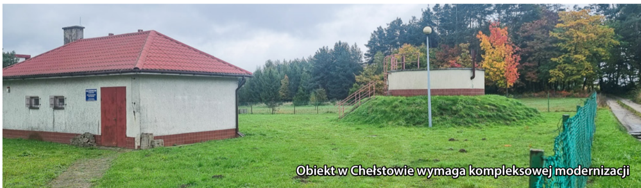
Obiekt w Chełstowie wymaga kompleksowej modernizacji

Wkrótce rozpocznie się przebudowa Stacji Uzdatniania Wody w Chełstowie, co zapewni mieszkańcom okolicznych miejscowości dostęp do wody o bardzo wysokich parametrach jakościowych. Inwestycja pozwoli także rozwiązać dotychczasowe problemy z okresowymi spadkami ciśnienia i awaryjnością obiektu. W piątek, 10 października 2025 roku, Zakład Gospodarki Komunalnej Sp. z o.o. w Twardogórze podpisał umowę z Bankiem Gospodarstwa Krajowego na finansowanie tego przedsięwzięcia w formie pożyczki pochodzącej ze środków Krajowego Planu Odnowy (KPO). Przygotowania do inwestycji trwały od kilku lat – dokumentacja projektowa wraz z pozwoleniem na budowę była gotowa już w maju 2023 r. Od tego czasu spółka komunalna intensywnie poszukiwała możliwości pozyskania środków zewnętrznych z krajowych i unijnych funduszy. Dopiero w marcu 2025 roku pojawiła się szansa na uzyskanie wsparcia z KPO w formie niskooprocentowanej pożyczki z BGK. Po przejściu wieloetapowego procesu oceny i weryfikacji, wniosek ZGK został pozytywnie rozpatrzony. Spółka uzyskała blisko 4 miliony złotych pożyczki na bardzo korzystnych warunkach – z oprocentowaniem 1% rocznie, okresem spłaty do 2040