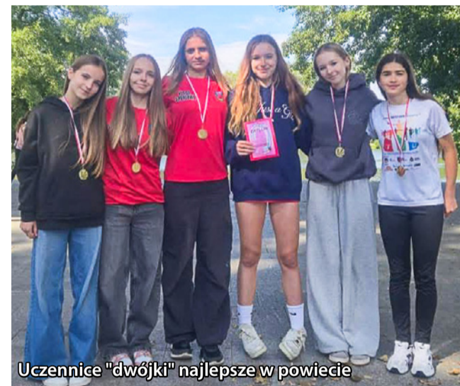
Uczennice "dwójki" najlepsze w powiecie

Uczennice z 8 klasy SP w Twardogórze bardzo dobrze zaprezentowały się w sztafetowych biegach przełajowych wokół stawów oleśnickich, w pięknym stylu zajęły 1. miejsce, czym zapewniły sobie udział w etapie wojewódzkim w Szklarskiej Porębie. Uczniowie klas trzecich uczestniczyli natomiast w lekkoatletycznych zawodach w ramach cyklu „Zacznij od lekkiej”, rywalizując w następujących konkurencjach: skok w dal i wżwyz, rzut piłeczką palantową, biegi na 60 i 200 m. Dzięki finansowaniu projektu przez Polski Związek Lekkiej Atletyki wszyscy uczestnicy otrzymali koszulki, medale, breloczki.