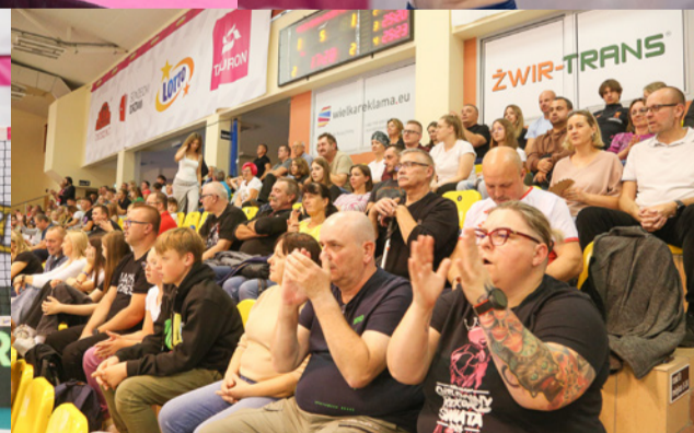
Tauron Giganci Siatkówki to determinacja na parkiecie i euforia na widowni

MASZ PROBLEM Z ALKOHOLEM? CHCESZ PRZESTAĆ PIĆ?