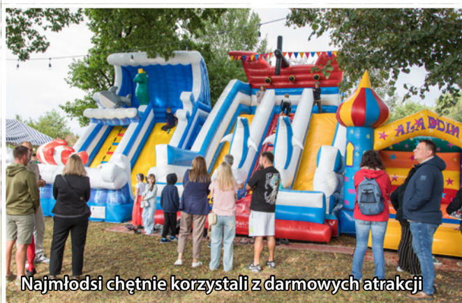
Najmłodzi chętnie korzystali z darmowych atrakcji