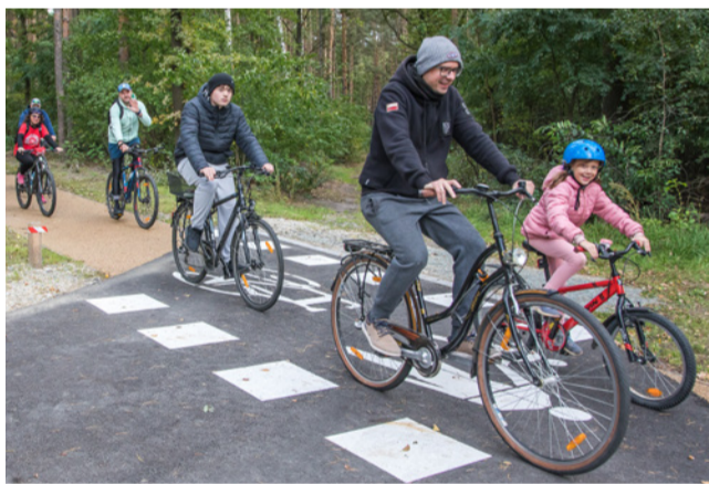
Rowerzyści przetestowali nową trasę

ju społecznego na Dolnym Śląsku, Działanie 5.2 Kultura i turystyka.