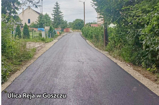
Ulica Reja w Goszczu

Obok dużych, strategicznych inwestycji, realizowane są również te mniejsze, ujęte we wnioskach budżetowych