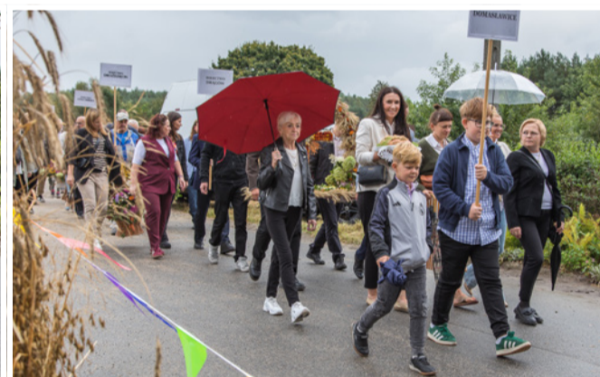
Wydarzenie rozpoczął korowód dożynkowy