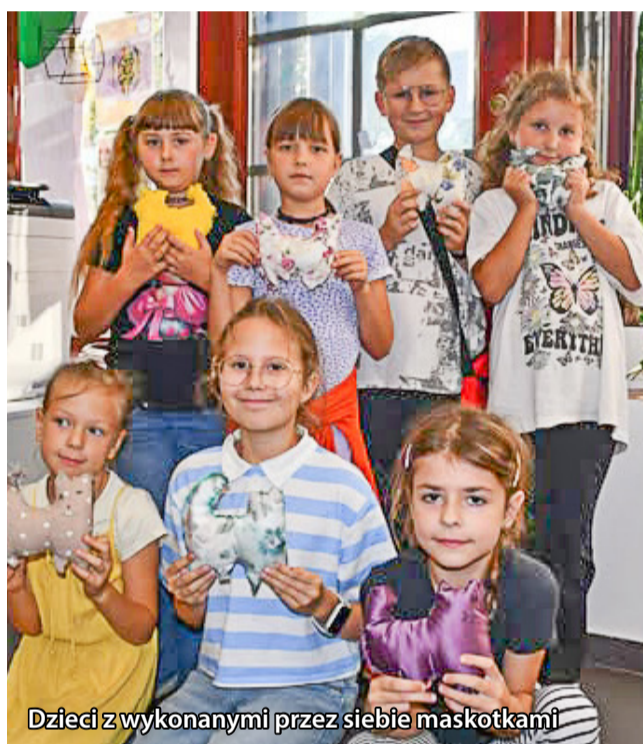
Dzieci z wykonanymi przez siebie maskotkami

W ostatnim czasie w TPK CAS odbywały się dwa cykle warsztatów kreatywnych dla dzieci – „Szyciaki – Iglą i nitką” oraz „Gliniaste Piątki”, które przyciągnęły wielu młodych miłośników sztuki i rękodzieła. Podczas zajęć z cyklu „Szyciaki – Iglą i nitką” uczestnicy poznawali podstawy szycia ręcznego, ucząc się cierpliwości, precyzji i samodzielności. Z kolorowych materiałów, guzików i nitki powstawały prawdziwe małe dzieła sztuki: maskotki-kotki, zawieszki w kształcie piesków oraz zakładki do książek. Każda praca była inna, wyjątkowa i pełna dziecięcej wyobraźni. Z kolei na „Gliniastych Piątkach” dzieci mogły spróbować swoich sił w lepieniu z gliny. W czasie zajęć powstały m.in. aniołki, podkładki na biżuterię oraz koniki z podkowami, które następnie zostały ozdobione sznurkami i pomalowane farbami. Praca z gliną dostarczyła najmłodszym mnóstwo radości, a przy okazji pozwoliła rozwijać zdolności manualne i twórcze myślenie. Warsztaty kreatywne to nie tylko nauka nowych umiejętności, ale także świetna zabawa, wspólna praca i budowanie relacji między dziećmi.