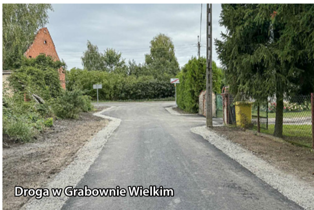
Droga w Grabownie Wielkim