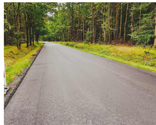
Zamiast dziur - piękna, nowa nawierzchnia

Dobiega końca jedna z najważniejszych inwestycji drogowych w naszej gminie – przebudowa drogi z Kolonii Strzelce do Grabowna Wielkiego. Długo wyczekiwane przedsięwzięcie znacząco poprawi komfort i bezpieczeństwo podróżowania mieszkańców naszej gminy oraz okolicznych miejscowości. Zadanie obejmuje przebudowę ponad 7-kilometrowego odcinka drogi, na co pozyskano dofinansowanie z Rządowego Funduszu Rozwoju Dróg w wysokości 3,58 mln zł. Całkowity koszt inwestycji to 5,52 mln zł. Gmina Twardogóra pokryje 12,25% wartości zadania, co stanowi znaczący wkład w rozwój lokalnej infrastruktury. Wykonawcą inwestycji jest firma Colas Polska. Dzięki tej inwestycji nową nawierzchnię zyskała też droga w samej miejscowości Grabowno Wielkie – od początku miejscowości do dworca kolejowego. Przebudowa drogi Strzelce – Grabowno Wielkie to kolejny przykład dobrej współpracy samorządów, której efektem będzie realna poprawa jakości życia mieszkańców. Dzięki temu przedsięwzięciu zwiększy się bezpieczeństwo ruchu drogowego, a Gmina Twardogóra zyska nowoczesny i funkcjonalny odcinek komunikacyjny w kierunku Wrocławia.