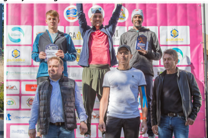
Twardogórski Bieg Uliczny to impreza z 31-letnią tradycją, która przyciąga biegaczy w różnym wieku i o zróżnicowanych umiejętnościach