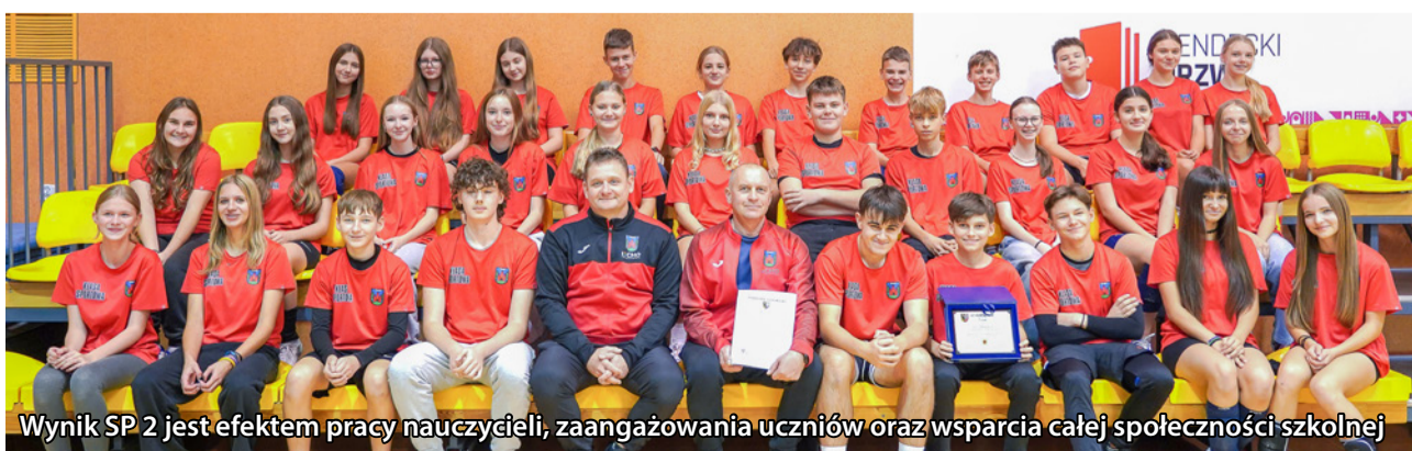
Wynik SP 2 jest efektem pracy nauczycieli, zaangażowania uczniów oraz wsparcia całej społeczności szkolnej