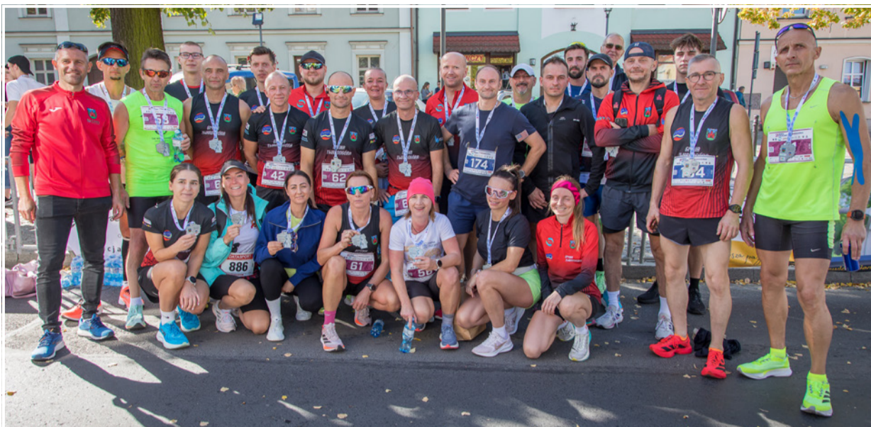
W biegu bierze udział liczna grupa mieszkańców gminy Twardogóra