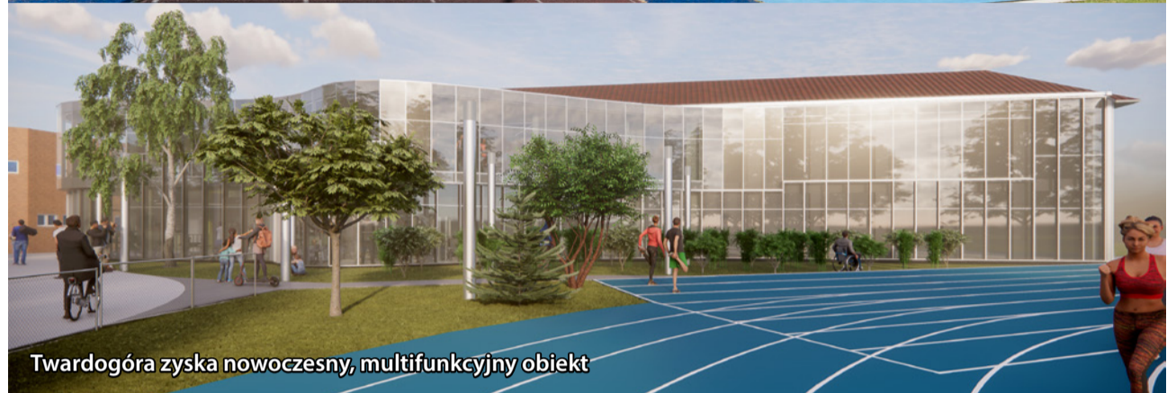
Twardogóra zyska nowoczesny, multifunkcyjny obiekt