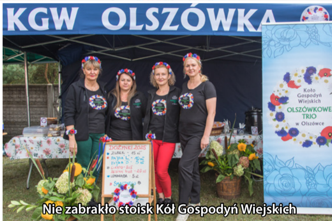
Nie zabrakło stoisk Kół Gospodyń Wiejskich