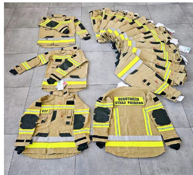
OSP w Domasławicach w ramach programu „Wzmocnij Swoje Otoczenie” - Edycja 2025, organizowanego przez Polskie Sieci Elektroenergetyczne S.A. zakupiła już 17 lekkich kurtek ochronnych

Ochotnicza Straż Pożarna W Grabownie Wielkim: Program „ORLEN na Straży” - 48 287 zł (środki ochrony indywidualnej i szkolenia), MSWiA - 6 865 zł, Gmina Twardogóra - 1 000 zł, FSUSR - 6 599,32 zł.