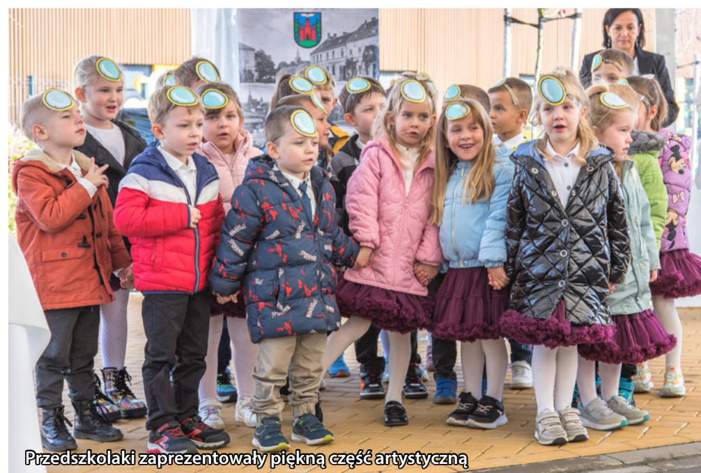
Przedszkolaki zaprezentowały piękną część artystyczną