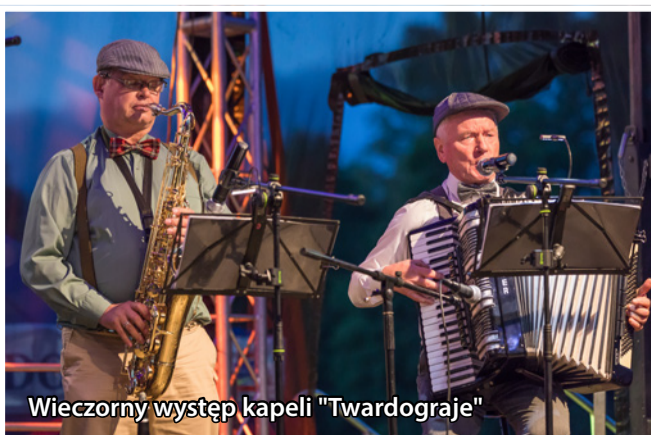
Wieczorny występ kapeli "Twardograje"