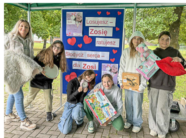
Akcja to piękny przykład współpracy całej społeczności