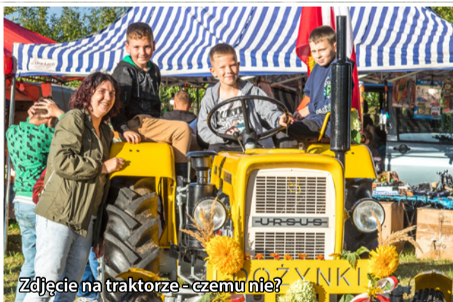
Zdjęcie na traktorze - czemu nie?