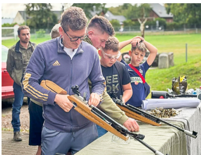
Mieszkańcy sprawdzili swoje umiejętności strzeleckie

Choć początek dnia zapowiadał się niepewnie, a niebo zasnuły chmury, słońce w końcu przebiło się przez szare niebo, przynosząc radość uczestnikom festynu „Dary Jesieni 2025” w Grabownie Wielkim. Wydarzenie zostało zorganizowane przez Sołtysa, Radę Sołecką oraz KGW Grabo-Jagi. Już od pierwszych chwil plac przy wiacie sołeckiej wypełnił się gwarem rozmów, śmiechem dzieci i zapachem pysznych potraw. Na odwiedzających czekały liczne atrakcje: dmuchaniec, słodka wata cukrowa, ogromne bańki mydlane, strzelnica plenerowa przygotowana przez Twardogórski Klub Strzelecki LOK HART, która cieszyła się ogromnym zainteresowaniem zarówno najmłodszych, jak i dorosłych uczestników oraz zabawa taneczna, którą poprowadził DJ Wojtek. Festyn po raz kolejny udowodnił, że w Grabownie drzemie ogromna społeczna energia, a jesień potrafi być nie tylko kolorowa, ale i pełna ciepła i uśmiechu.