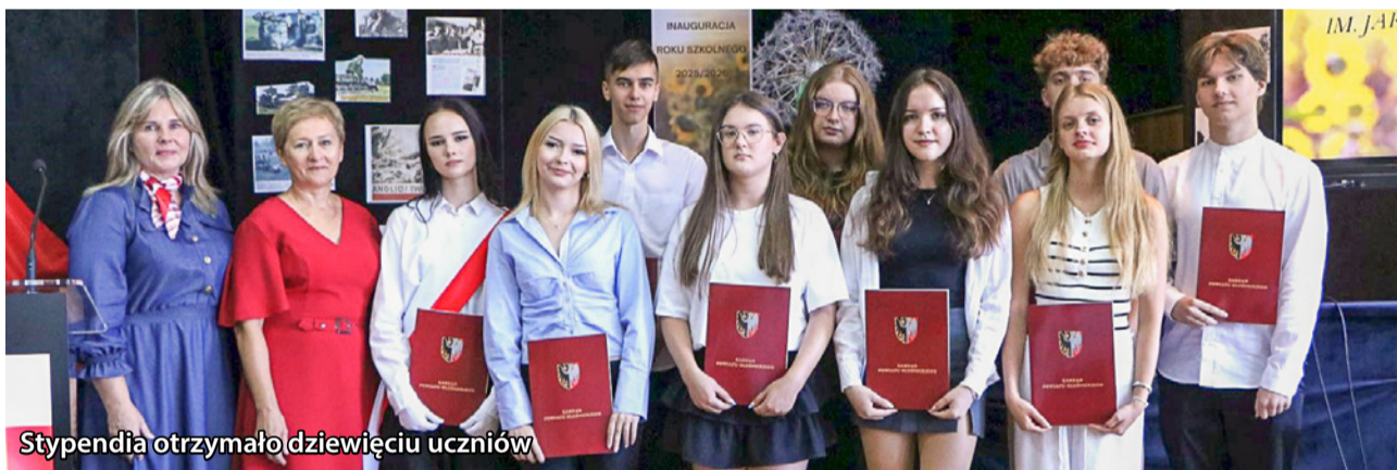
Stypendia otrzymało dziewięciu uczniów