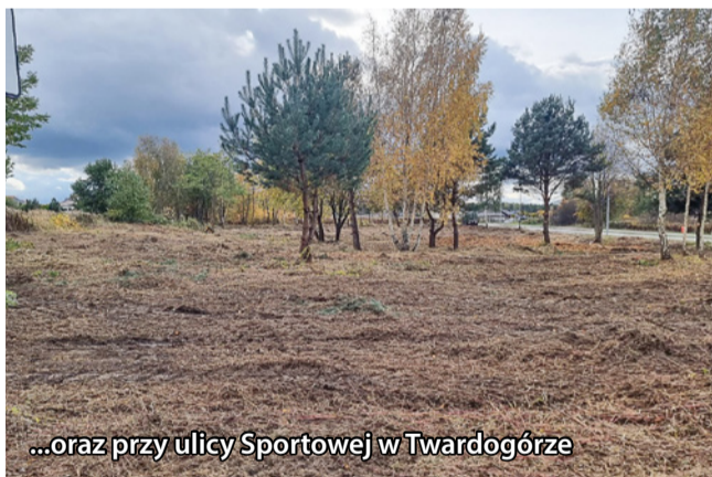
...oraz przy ulicy Sportowej w Twardogórze