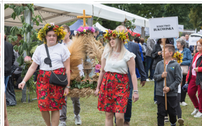
Delegacje dożynkowe podczas wspólnego przemarszu