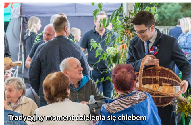
Tradycyjny moment dzielenia się chlebem