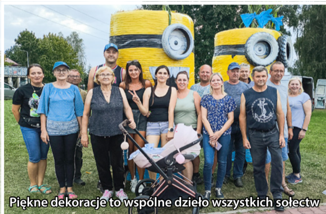
Piękne dekoracje to wspólne dzieło wszystkich sołectw