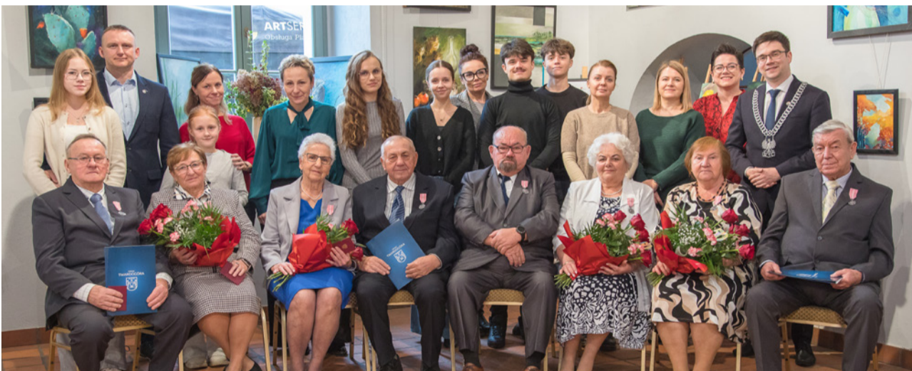
Pół wieku razem - piękny przykład miłości, wierności i wspólnej drogi przez życie