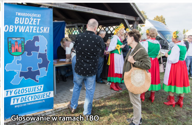
Głosowanie w ramach TBO