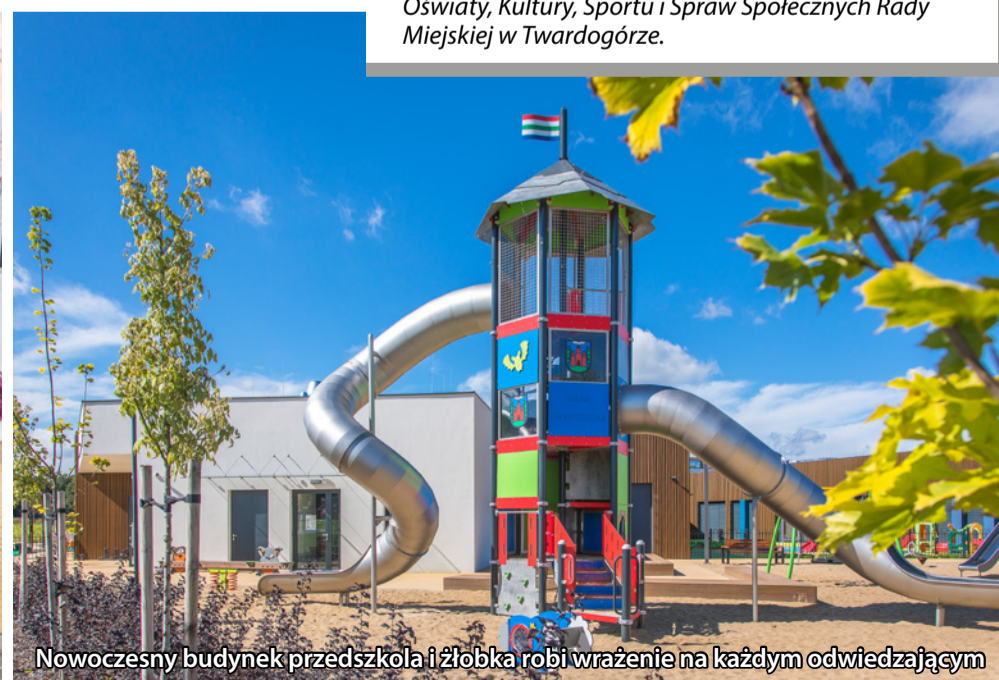
Nowoczesny budynek przedszkola i żłobka robi wrażenie na każdym odwiedzającym