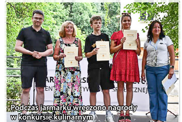
Podczas jarmarku wręczono nagrody w konkursie kulinarnym