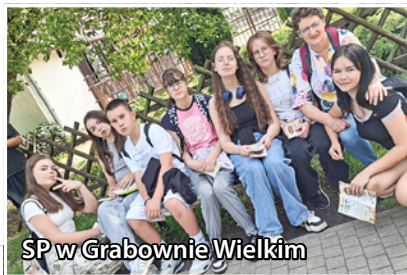
SP w Grabownie Wielkim