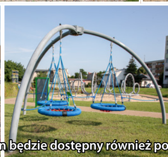
Teren będzie dostępny również poza godzinami otwarcia placówki