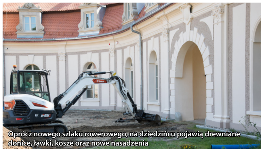
Oprócz nowego szlaku rowerowego, na dziedzińcu pojawią drewniane donice, ławki, kosze oraz nowe nasadzenia