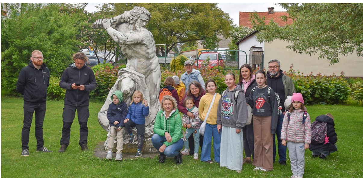
Uczestnicy gry terenowej rozwiązywali zadania, a na mecie czekały na nich dyplomy i upominki

Projekt był współfinansowany ze środków Polsko-Amerykańskiej Fundacji Wolności w ramach programu „Kurs na Odporność” realizowanego wspólnie przez Fundację Edukacja dla Demokracji oraz Fundację Szkoła z Klasą.