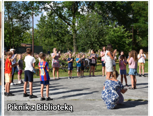
Piknik z Biblioteką