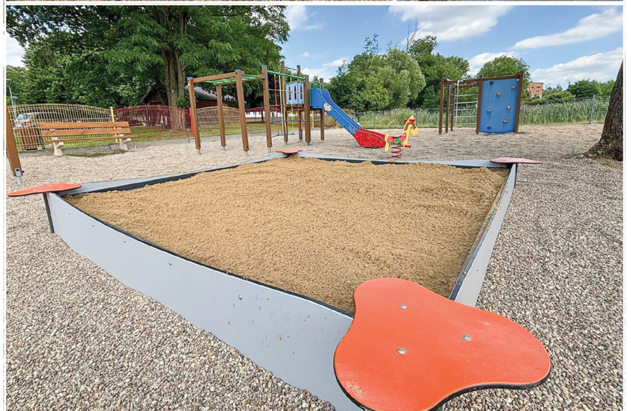
Inicjatywa jest przykładem na to, że wspólne działania mają sens i realnie poprawiają przestrzeń wspólną. Brawo!