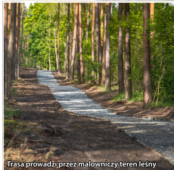
Trasa prowadzi przez malowniczy teren leśny