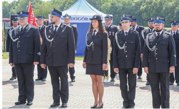
Strażacy zostali uhonorowani za wieloletnią i pełną poświęcenia służbę