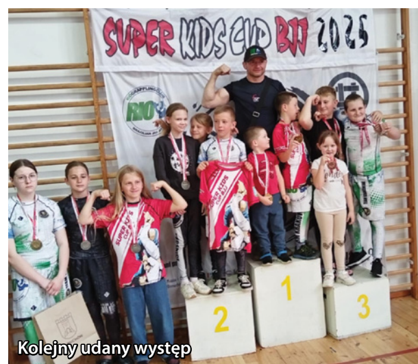
Kolejny udany występ