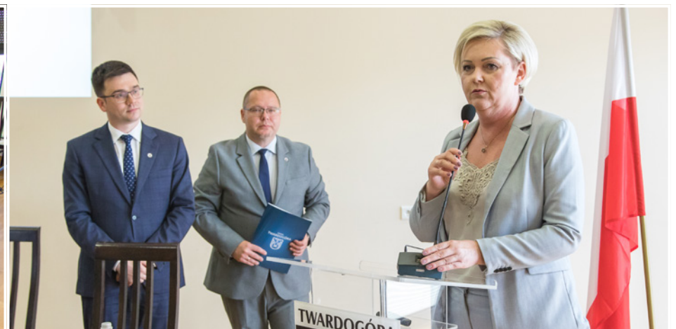
Pamiętkowe zdjęcie po sesji Rady Miejskiej, na której podsumowano 2024 rok