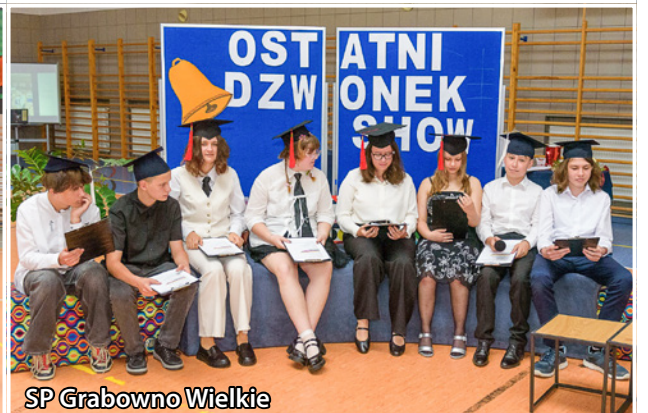
SP Grabowno Wielkie