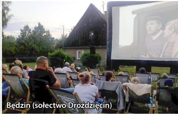
Będzin (sołectwo Drożdżęcín)