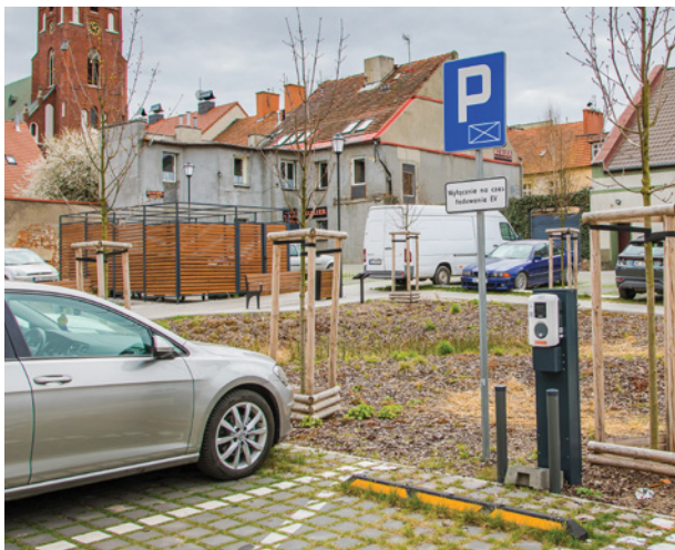
To pierwsza stacja ładowania w naszej gminie