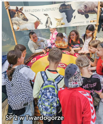
SP 2 w Twardogórze