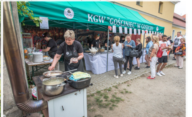
KGW „Gościniec” serwowało m.in. „Kotlet Dziedzica”