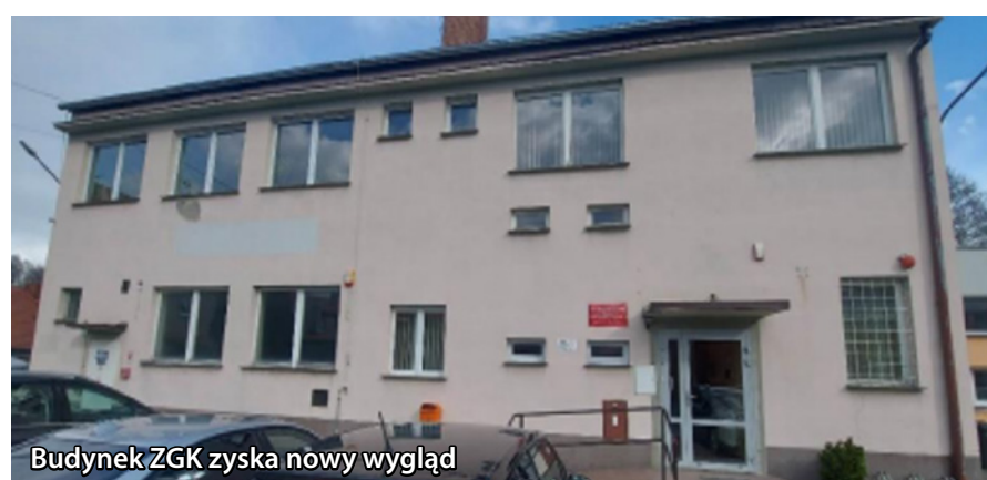
Budynek ZGK zyska nowy wygląd

Po zakończeniu inwestycji 4 obiekty Zakładu Gospodarki Komunalnej sp. z o.o. w Twardogórze będą wyposażone w instalacje fotowoltaiczne, a w najbliższym czasie jest zaplanowana jeszcze bardzo duża inwestycja związana z przebudową SUW w Chełstowie, gdzie również zaplanowane jest wykonanie instalacji fotowoltaicznej.