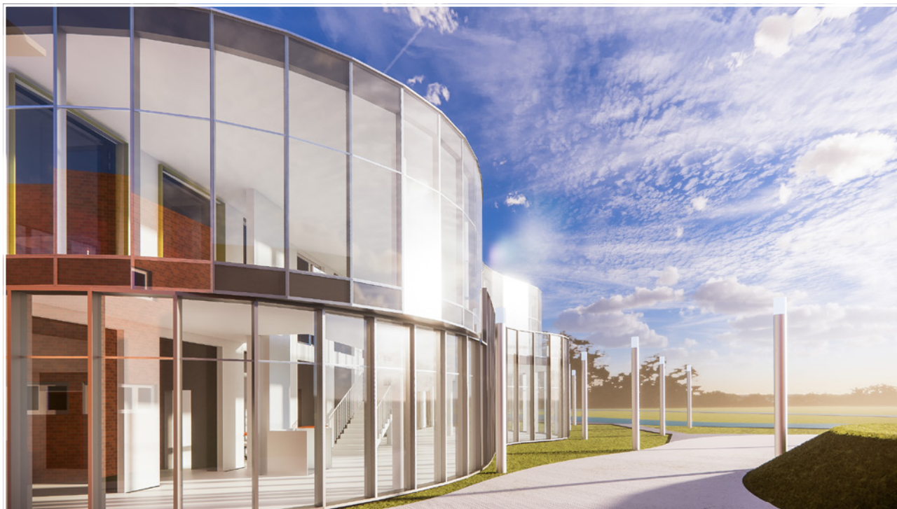
Gmina Twardogóra pozyskała 900 tys. dofinansowania z budżetu Województwa Dolnośląskiego

tematy związane z planowanym wyposażeniem, godzinami otwarcia obiektu, komunikacją wewnętrzną, kwestiami bezpieczeństwa, systemem wejścia oraz dostępem do siłowni. Mieszkańcy mogli zgłosić uwagi także drogą elektroniczną. Wszystkie sugestie oraz pomysły zostały przekazane projektantom.