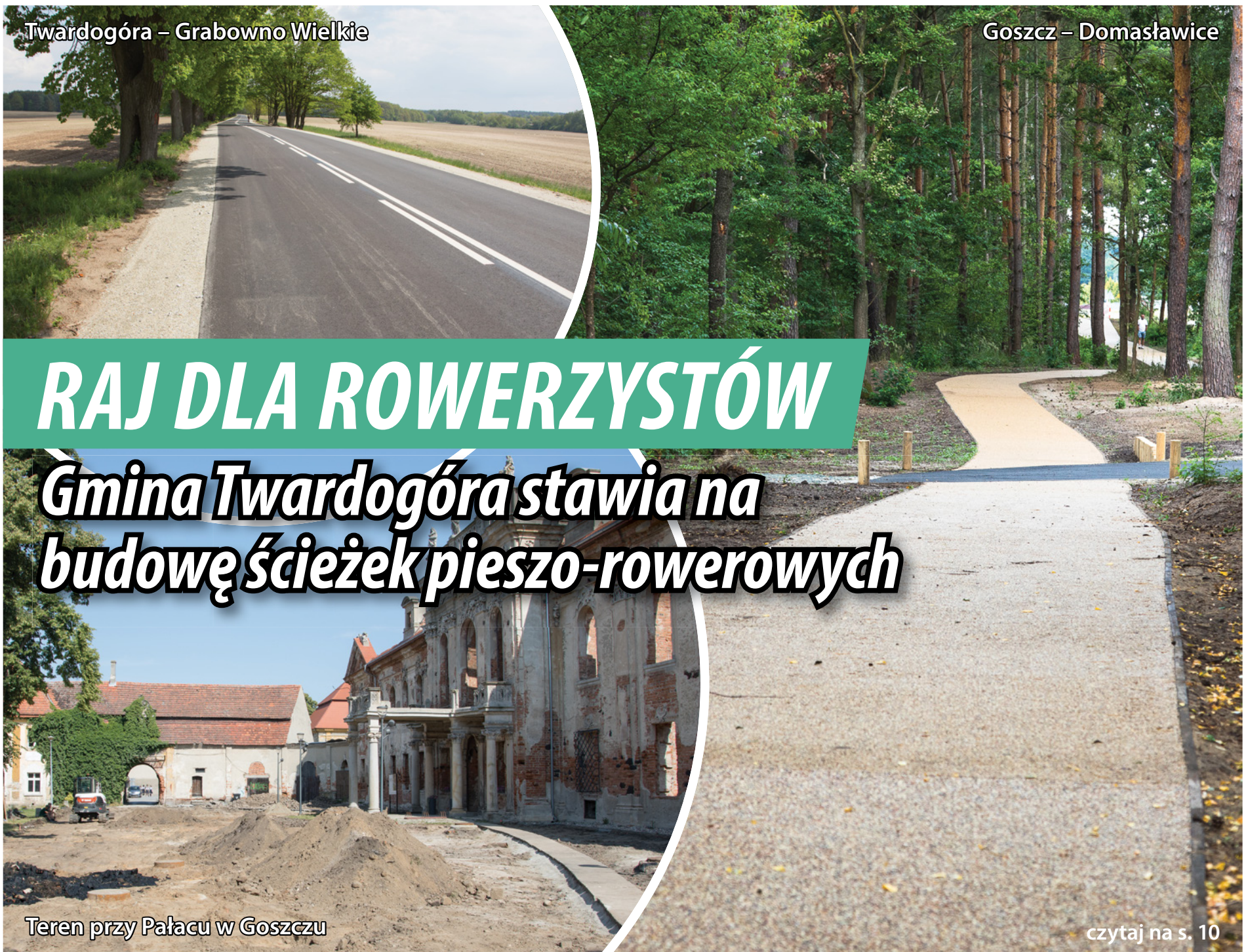
Twardogóra – Grabowno Wielkie