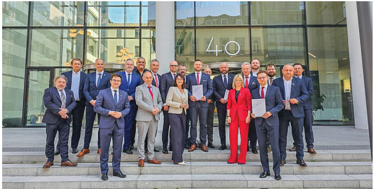
Spotkanie w Brukseli było możliwe dzięki dołączeniu naszej gminy do Stowarzyszenia Aglomeracja Wroclawska - organizacji łączącej 28 gmin i jeden powiat z dawnego województwa wroclawskiego

na forum międzynarodowym. Podczas wizyty odbyły się spotkania z europosłami: Bogdanem Zdrojewskim, Andrzejem Bułą, Krzysztofem Hetmanem i Michałem Kobosko. Poruszono w rozmowach kluczowe tematy dla regionu – m.in. przyszłość polityki spójności, nowe Wieloletnie Ramy Finansowe UE oraz znaczenie miast w polityce europejskiej.