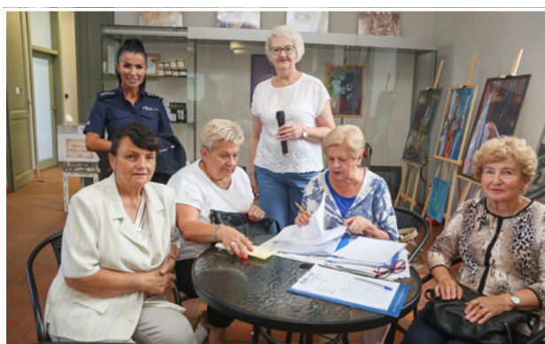
W prelekcjach wzięło udział 45 uczestników

Seniorzy zrzeszeni w Kole Terenowym PZERiI w Goszczu wzięli udział w projekcie „Bądźmy Razem – Strefa Bezpieczeństwa” sfinansowanym z budżetu Województwa Dolnośląskiego. Podczas spotkania w sali wystawienniczej pałacu w Goszczu dowiedzieli się m.in. jak zadbać o siebie w czasie upałów, jakie są symptomy odwodnienia, jak rozpoznać oraz udzielić pierwszej pomocy przy zawale, udarze mózgu, arytmii, wysokim ciśnieniu czy zadławieniu. Następnie wysłuchali prelekcji o bezpieczeństwie w ruchu drogowym. Otrzymali także szelki odbłaskowe z herbem Gminy Twardogóra, przydatne podczas poruszania się po zmroku.