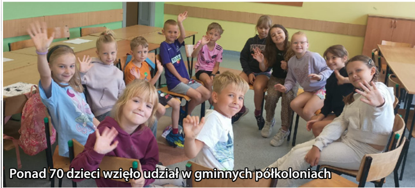
Ponad 70 dzieci wzięło udział w gminnych półkoloniach