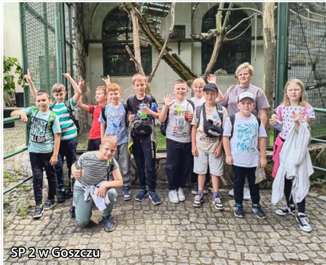
SP 2 w Goszczu

Uczniowie SP 2 w Twardogórze, SP w Goszczu i SP w Grabownie Wielkim wzięły udział w wiosennej akcji sprzątania Gminy Twardogóra. Nagrodą za udział w szlachetnej akcji były bilety do wrocławskiego ZOO przekazane przez Aglomerację Wrocławską. Transport do Wrocławia zapewniła Gmina Twardogóra.