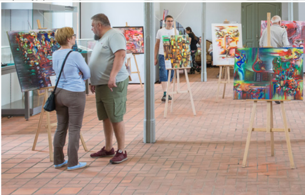
Majówka obfitowała w wiele atrakcji