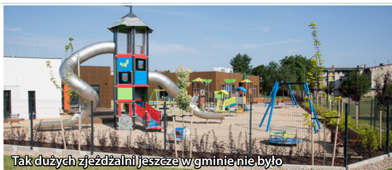
Tak dużych zjeżdżalni jeszcze w gminie nie było

Przy budynku nowego przedszkola powstaje plac zabaw. Będą na nim m.in.: zjeżdżalnie, tyrolka, huśtawki oraz wiele innych urządzeń dedykowanych dzieciom w różnym wieku. Zadbano także o rodziców, którzy będą mogli odpocząć na ławeczkach i leżankach. Teren został obsadzony nową roślinnością - będzie to miejsce bezpieczne i przyjazne dla mieszkańców. Inwestycja powstaje w ramach II etapu budowy nowego przedszkola, który obejmuje także budowę 5 oddziałów przedszkolnych, oddział żłobka, wewnętrzne instalacje, wyposażenie całego budynku oraz zagospodarowanie terenu. Przedszkolaki będą mogły korzystać z całego obiektu już od września. Wykonawcą zadania jest firma AWM Budownictwo S.A. z Wrocławia - za kwotę 10 407 957,77 zł. Gmina Twardogóra pozyskała dofinansowanie w wysokości 8 000 000,00 zł - w ramach Rządowego Funduszu Polski Ład: Program Inwestycji Strategicznych, 986 829,37 zł - z Programu Aktywny Maluch 2022-2029. Pozostałe środki, tj. 1 421 128,40 zł - pochodzą z budżetu Gminy Twardogóra.