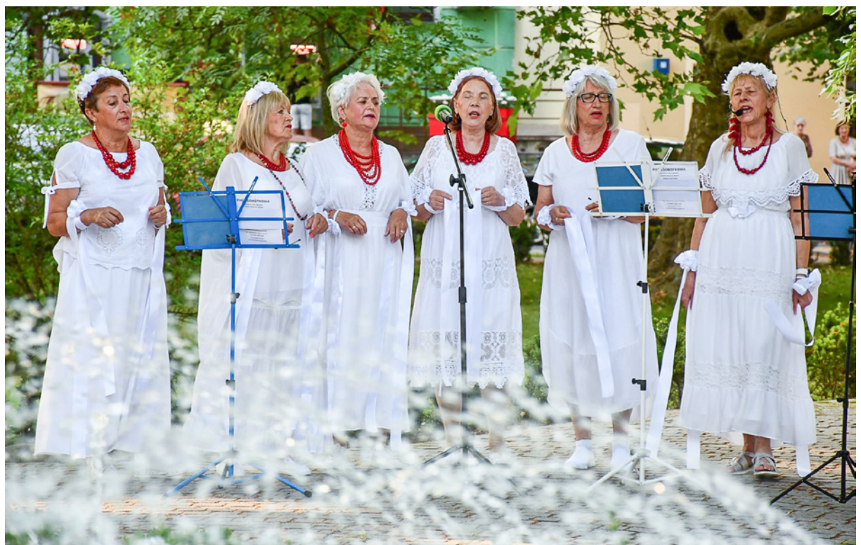
Występ Zespołu Pieśni i Tańca Skorynianki