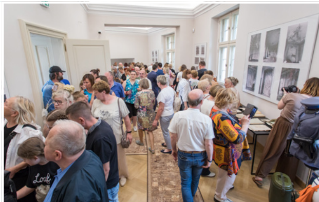
Wystawa w lapidarium