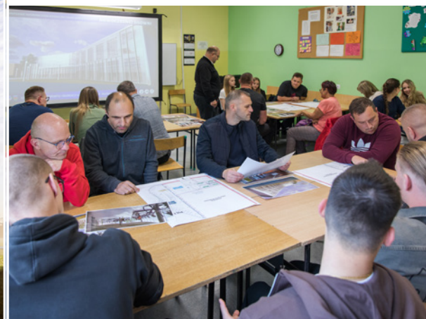
Mieszkańcy zapoznali się z projektem i rozmawiali o przyszłym funkcjonowaniu siłowni