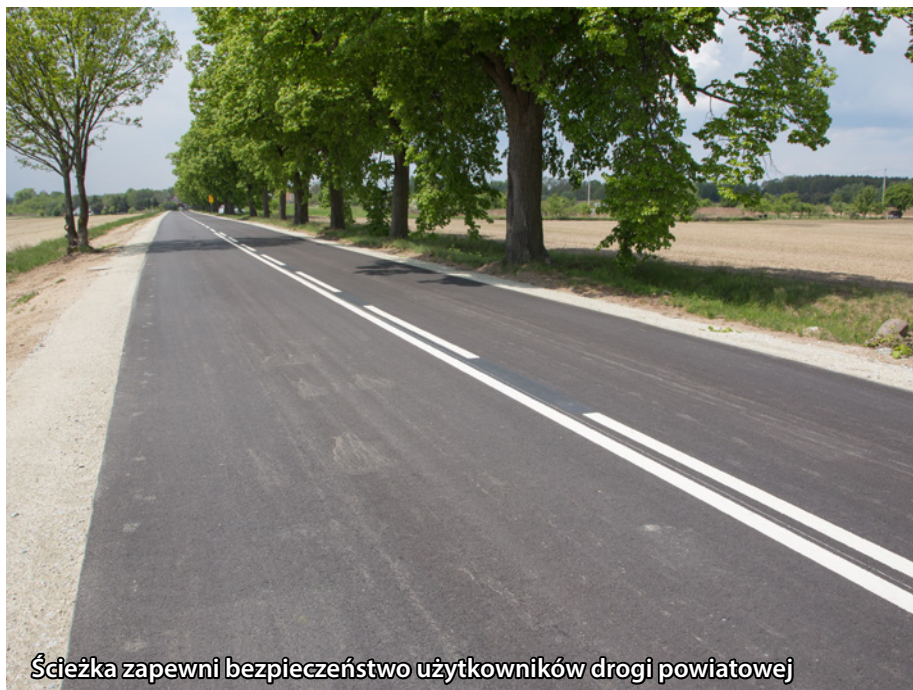
Ścieżka zapewni bezpieczeństwo użytkowników drogi powiatowej

w pobliżu kościoła w Grabownie Wielkim. Dzięki temu mieszkańcy i turyści zyskają bezpieczne i wygodne połączenie pomiędzy miejscowościami, które sprzyja zarówno rekreacji, jak i codziennym dojazdom rowerem czy spacerem. Na początku Grabowna, tuż przy blokach mieszkalnych, zaplanowano również budowę wyniesionego przejścia dla pieszych. Poprawi to bezpieczeństwo wszystkich użytkowników drogi, zwłaszcza dzieci i osób starszych.