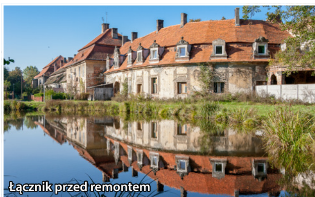
Łącznik przed remontem

Zespół pałacowo-parkowy w Goszczu od kilku lat przechodzi prawdziwą metamorfozę, która krok po kroku przywraca mu dawny blask. Jednym z jej elementów jest łącznik wschodni – budynek, który jeszcze niedawno wymagał gruntownych prac remontowych. Dziś możemy podziwiać efekty pierwszego etapu prac, które znacząco zmieniły jego wygląd i funkcjonalność. Prace objęły nie tylko remont dachu, odnowienie elewacji czy wymianę stolarki drzwiowej i okiennej, ale także zagospodarowanie parteru, gdzie dziś mieści się lapidarium oraz toaleta dla gości. Planowany jest kolejny, niezwykle ważny etap inwestycji. Trwa obecnie postępowanie przetargowe, które wyłoni wykonawcę II etapu prac. Na parterze budynku powstanie przytulny apartament, natomiast na I piętrze zaplanowano kolejne apartamenty oraz klimatyczną kawiarenkę z zapleczem sanitarnym. Remont łącznika wschodniego, to kolejny krok w kierunku ożywienia i otwarcia zespołu pałacowo-parkowego w Goszczu na mieszkańców i odwiedzających. Już dziś widać, że to miejsce ma szansę stać się perełką regionu – nie tylko jako zabytek, ale przestrzeń spotkań i relaksu.