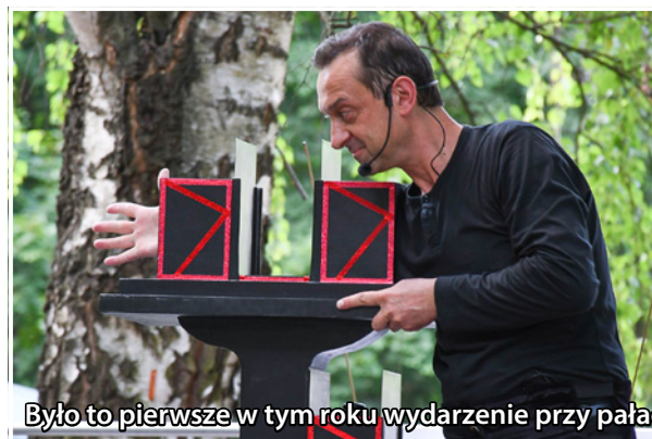
Było to pierwsze w tym roku wydarzenie przy pałacu barokowym w Twardogórze