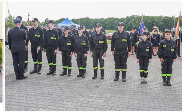
Młodzieżowa Drużyna Pożarnicza