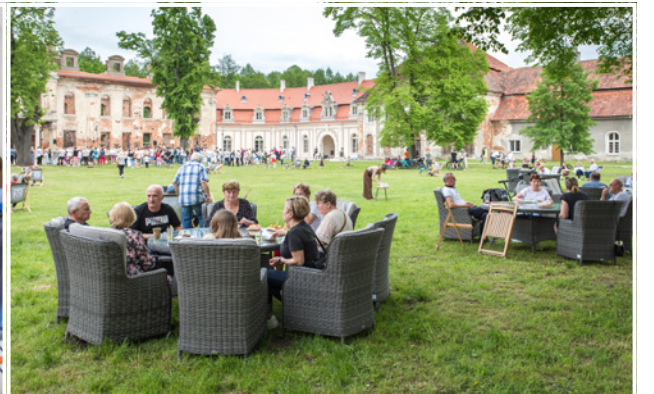
Pałacowy dziedziniec tętnił życiem