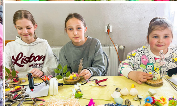
Mieszkańcy kultywowali tradycję i zwyczaje wielkanocne