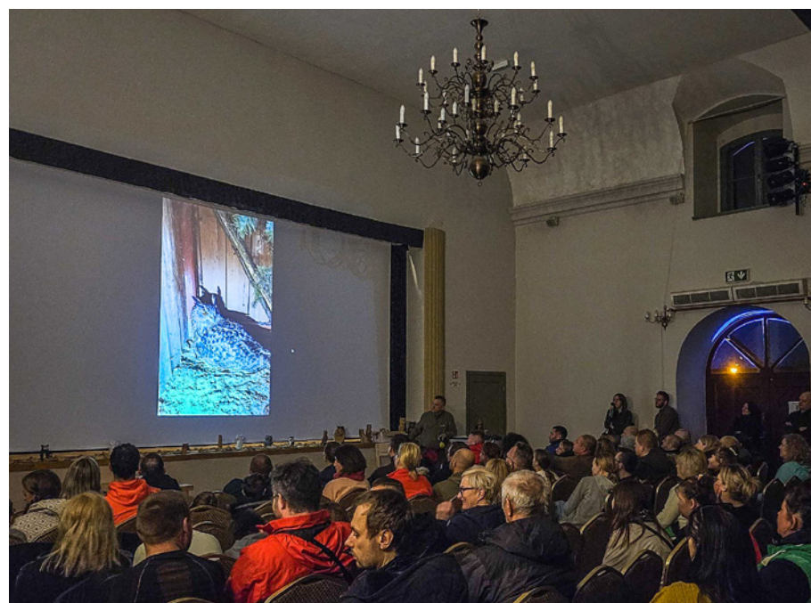
Ze względu na duże zainteresowanie wydarzenie odbyło się 14 i 28 marca

Tok, uczestnicy mieli możliwość połączenia się z SowaJaga – ekspertem w dziedzinie sów, który podzielił się swoją wiedzą oraz doświadczeniem w pracy. Po części teoretycznej uczestnicy wyruszyli do pobliskiego lasu, by nasłuchiwać i wypatrywać sów w ich naturalnym środowisku. Spacer wśród drzew, przy delikatnym świetle księżycy, dostarczył wielu niezapomnianych wrażeń i spotkań z dziką przyrodą. Zwieńczeniem każdego z wieczorów było ognisko, przy którym uczestnicy dzielili się swoimi spostrzeżeniami i doświadczeniami z obserwacji.