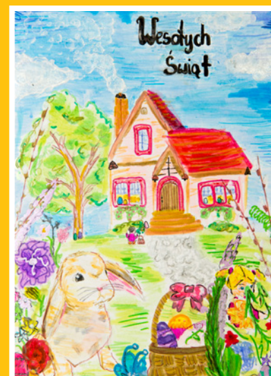
Natasza Nowak Szkoła Podstawowa nr 2 w Twardogórze