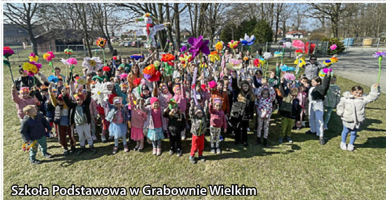
Szkoła Podstawowa w Grabownie Wielkim