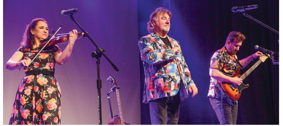
Artysta zaprezentował ballady oraz pełne energii utwory biesiadne i country

że w hali sportowo-widowskowej Gminnego Ośrodka Sportu i Rekreacji w Twardogórze panowała wspólna atmosfera.