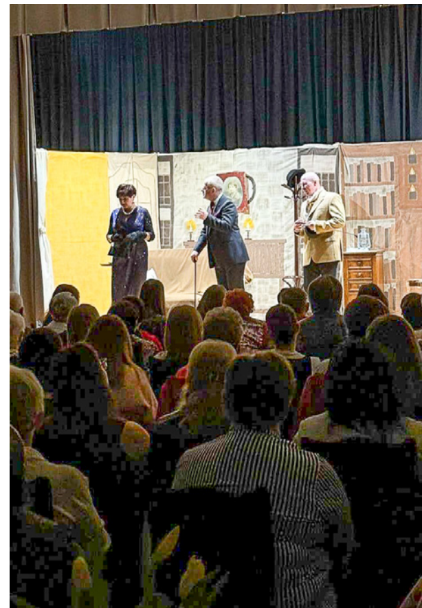
Spektakl w wykonaniu naszych mieszkańców dostarczył widzom mnóstwo radości.