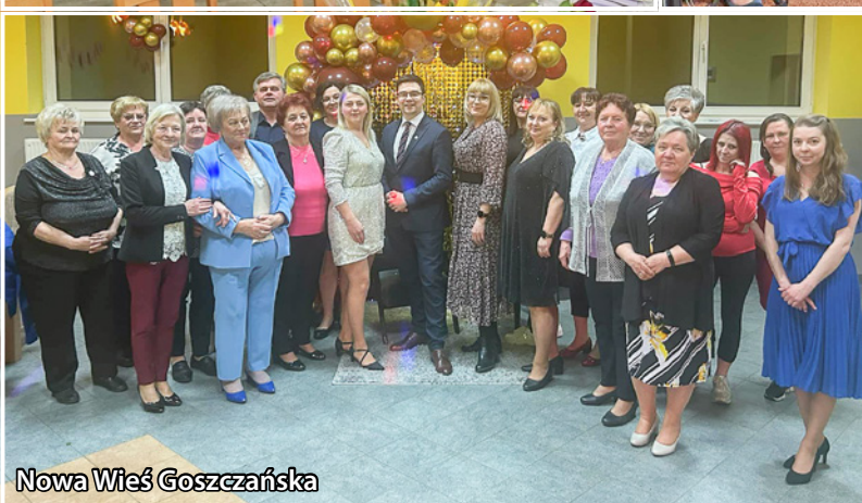
Nowa Wieś Goszczańska