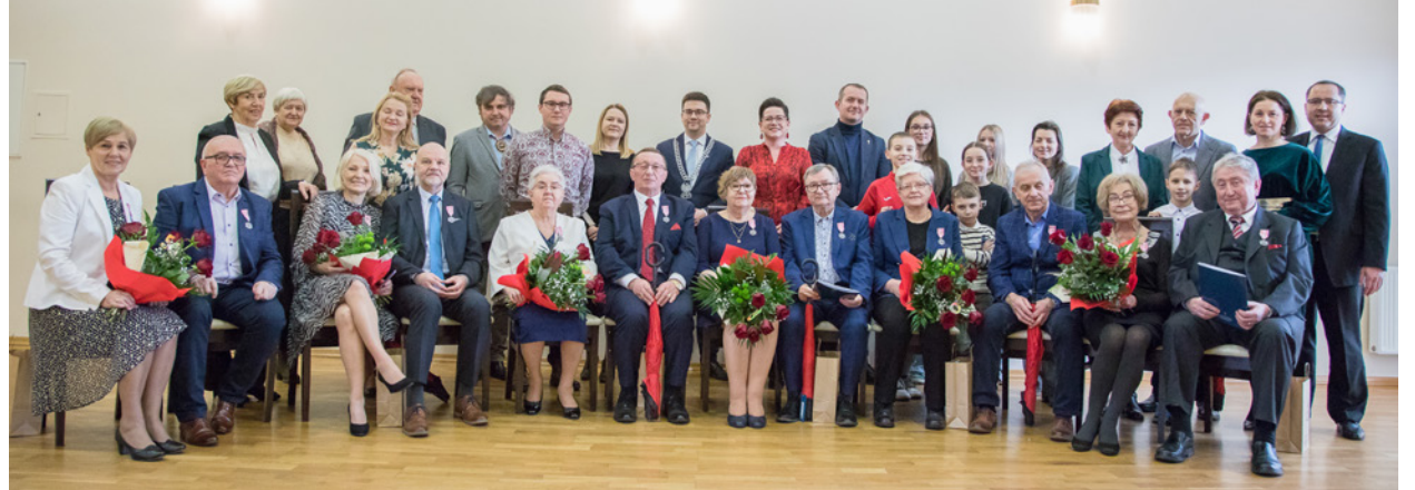
Jubileusz jest świadectwem miłości, wytrwałości i wzajemnego wsparcia przez pół wieku wspólnego życia