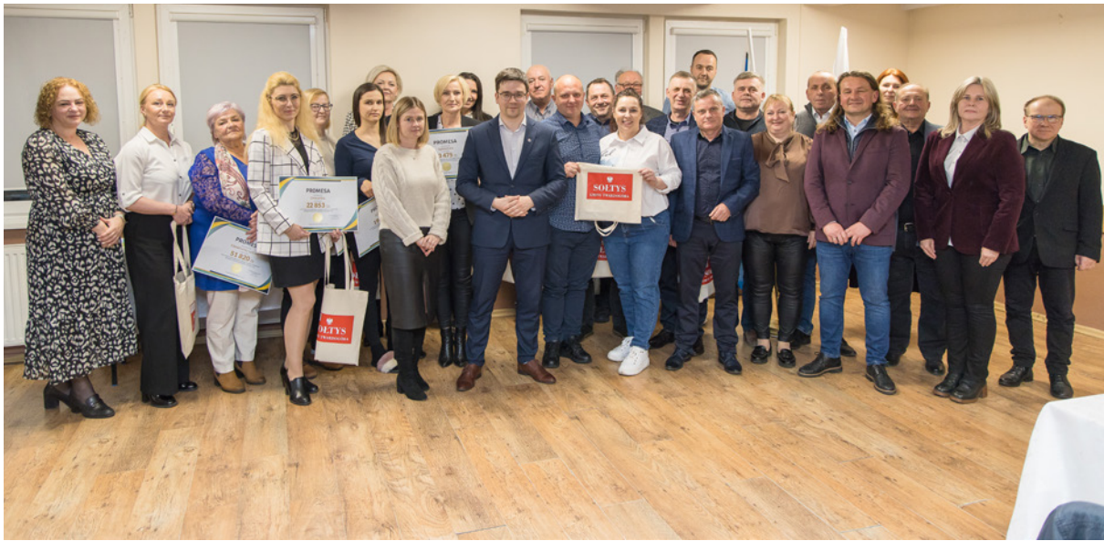
Spotkanie było także okazją do złożenia życzeń wszystkim Sołtysom oraz podziękowania za ich codzienną pracę, zaangażowanie i dbałość o sprawę mieszkańców