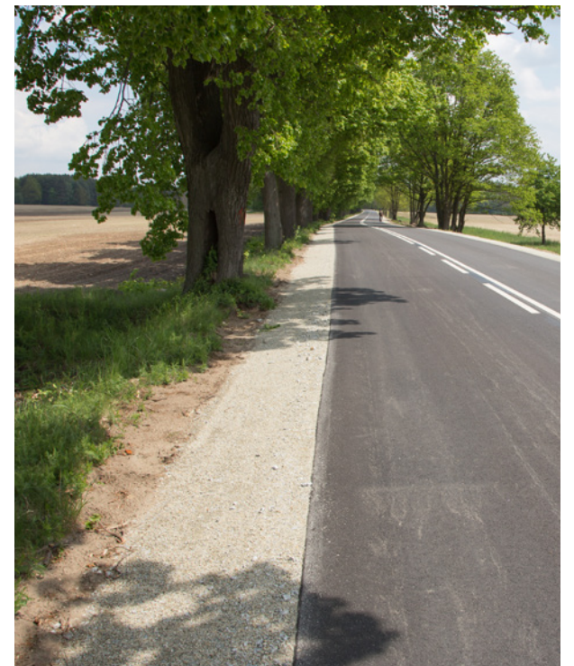
Nowa ścieżka poprawi bezpieczeństwo użytkowników drogi

Gmina Twardogóra realizuje dokumentację projektową budowy ścieżki pieszo-rowerowej, która połączy Twardogórę z Grabownem Wielkim. Nowa trasa będzie biegła od ronda w kierunku Dąbrowy do skrzyżowania przy kościele w Grabownie Wielkim. Planowana szerokość ścieżki to 3 metry, co umożliwi bezpieczne i komfortowe korzystanie z niej zarówno pieszym, jak i rowerzystom. Trwają rozmowy nad przebiegiem ścieżki w pobliżu rezerwatu przyrody "Torfowisko koło Grabowna Wielkiego", aby wypracować najlepsze rozwiązania, które pogodzą potrzeby inwestycyjne z koniecznością ochrony unikalnych walorów przyrodniczych. Wzrost bezpieczeństwa, lepsze połączenie komunikacyjne oraz dodatkowa przestrzeń do rekreacji - to tylko niektóre z zalet planowanej inwestycji.