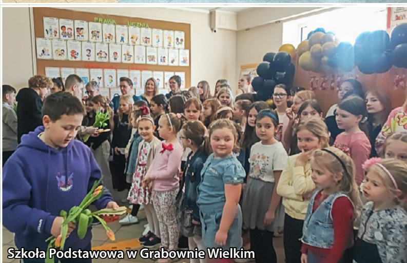
Szkoła Podstawowa w Grabownie Wielkim