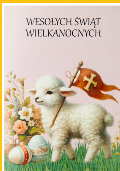
Wiktorija Stasiak Zespół Szkół Ponadpodsta- wowych w Twardogórze