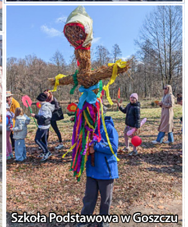
Szkoła Podstawowa w Goszczu