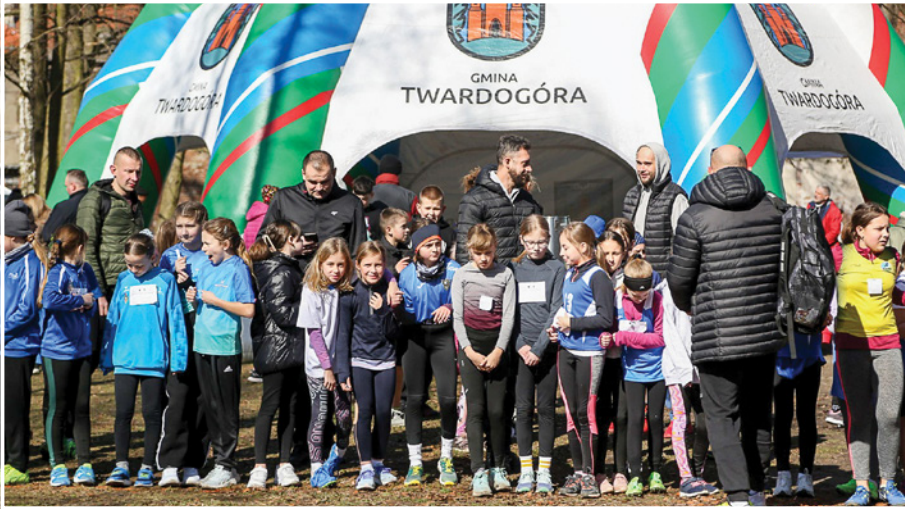
W zawodach wzięło udział kilkaset biegaczy