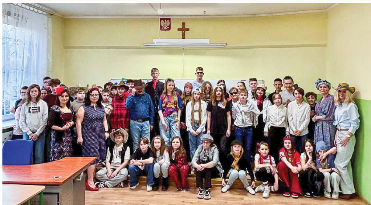
Dzieci, ubrane w kolorowe stroje brały udział w licznych konkursach, grach oraz wspólnych tańcach