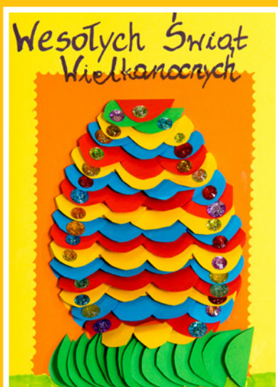
Bartłomiej Szydełko Szkoła Podstawowa nr 2 w Twardogórze