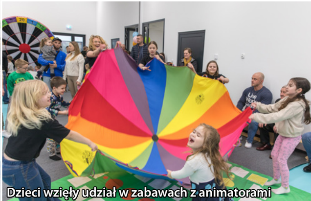
Dzieci wzięły udział w zabawach z animatorami