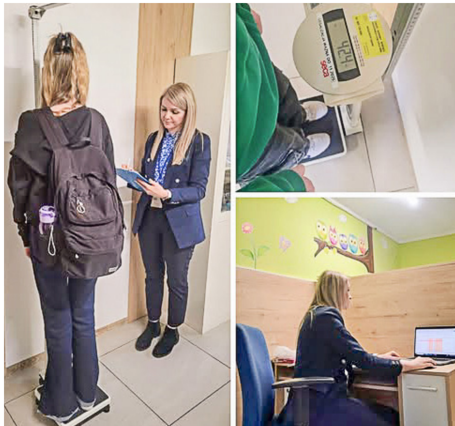
Przeciążone i nieprawidłowo noszone tornistry mogą prowadzić do poważnych wad postawy

żyć więcej niż 10–15% masy ciała ucznia, powinien posiadać usztywnioną ściankę przylegającą do pleców, ciężar powinien być rozłożony równomiernie, cięższe rzeczy należy umieszczać na dnie, a lżejsze wyżej, powinien mieć równe, szerokie szelki, tornister należy nosić na obu ramionach. Dodatkowo podkreślono, że długość szelek powinna umożliwiać swobodne wkładanie i zdejmowanie plecaka, zapewniając jednocześnie jego optymalne przyleganie do pleców. Warto również stosować dodatkowe zapięcie spinające szelki na klatce piersiowej.