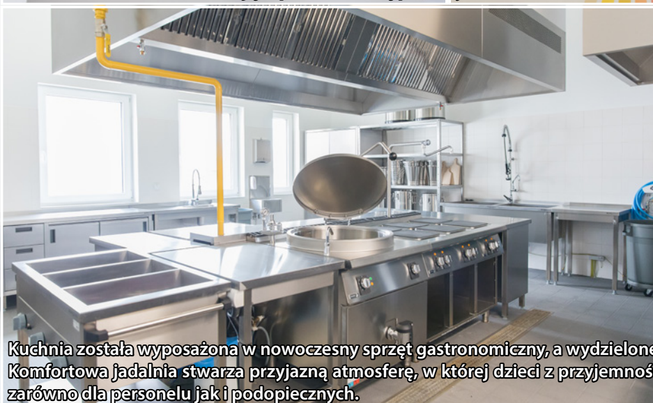
Kuchnia została wyposażona w nowoczesny sprzęt gastronomiczny, a wydzielone strefy pracy i chłodnia zapewniają najwyższe standardy przygotowania posiłków. Komfortowa jadalnia stwarza przyjazną atmosferę, w której dzieci z przyjemnością spożywają posiłki, a odpowiednia organizacja przestrzeni gwarantuje wygodę zarówno dla personelu jak i podopiecznych.