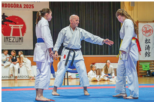
Zawodnicy prezentowali swoje umiejętności w kata i kumite

Klub Karate-Do Shotokan Irezumi zorganizował w marcu Ogólnopolski Turniej Karate Młodzików. Wydarzenie, które odbyło się w hali sportowo-widowiskowej Gminnego Ośrodka Sportu i Rekreacji w Twardogórze było pełne sportowej rywalizacji, ducha fair play i niezapomnianych emocji. Zawodnicy rywalizowali w różnych kategoriach wiekowych z podziałem na pasy, prezentując swoje umiejętności w kata i kumite. Po zaciętej rywalizacji najlepsi otrzymali puchary i medale.