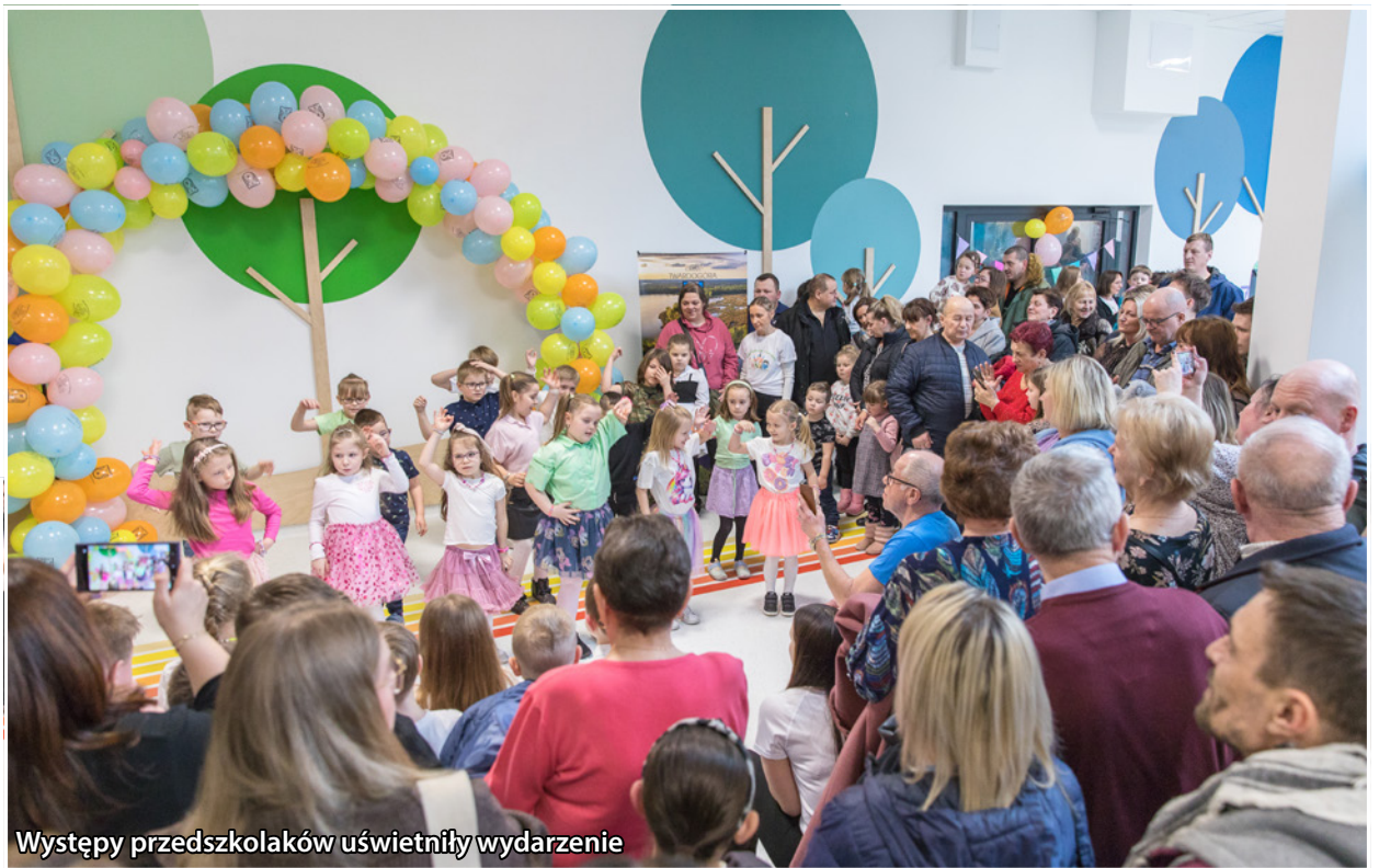
Występy przedszkolaków uświetniły wydarzenie