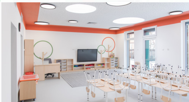
Od 3 marca dzieci mają zajęcia w przestronnych i w pełni wyposażonych salach, do których prowadzą kolorowe oznaczenia ułatwiające poruszanie się po budynku