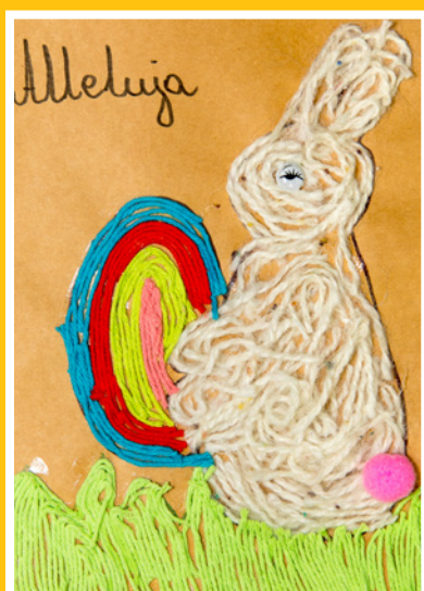
Oliwia Piech Miejskie Przedszkole w Twardogórze