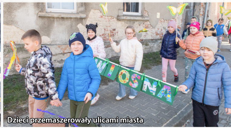
Dzieci przemaszerowały ulicami miasta