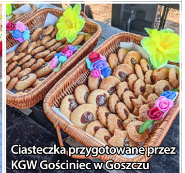
Ciasteczka przygotowane przez KGW Gościniec w Goszczu