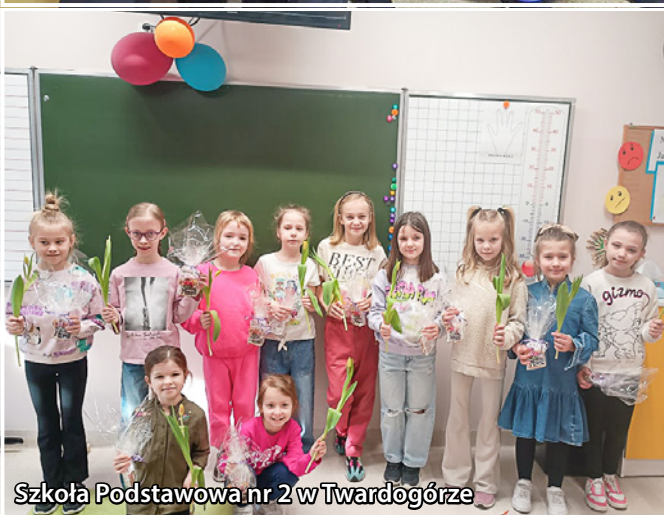
Szkoła Podstawowa nr 2 w Twardogórze