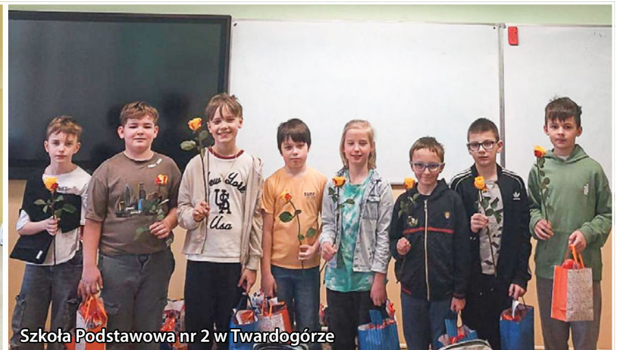
Szkoła Podstawowa nr 2 w Twardogórze