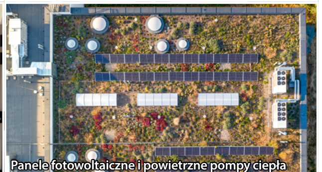
Panele fotowoltaiczne i powietrzne pompy ciepła znacząco zredukują zużycie energii, a zielony dach i ściany poprawią mikroklimat, pochłaniając CO 2