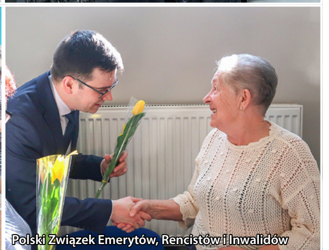
Polski Związek Emerytów, Rencistów i Inwalidów