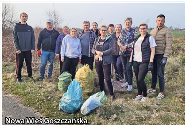
Nowa Wieś Goszczańska