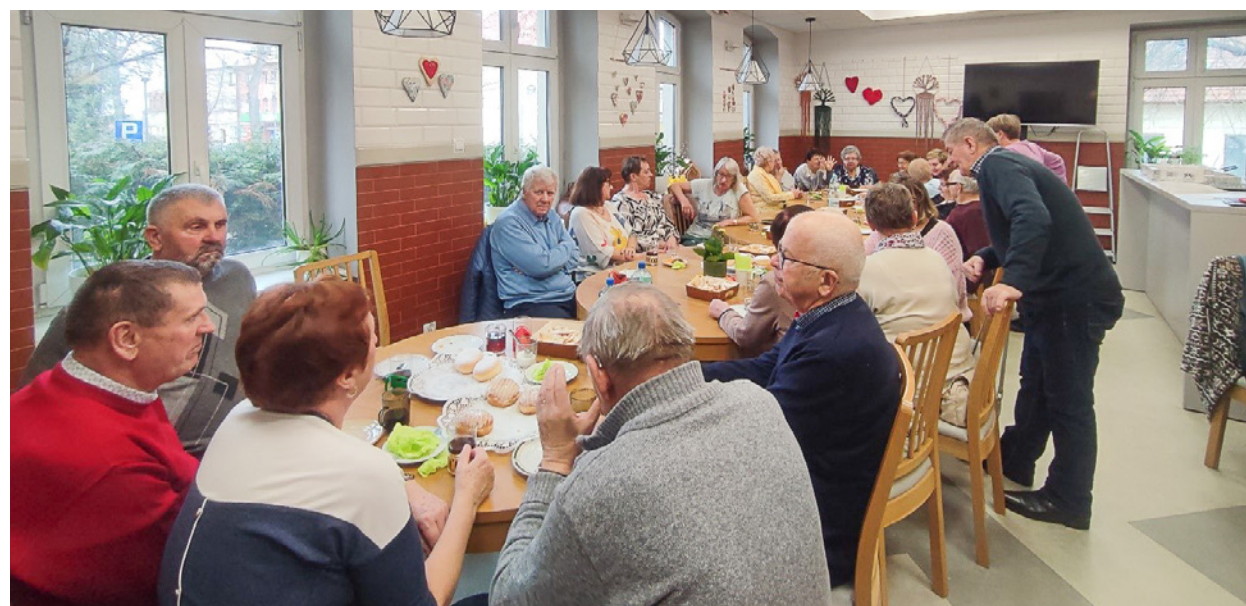
Tłusty Czwartek to nie tylko okazja do skosztowania słodkich przysmaków, ale przede wszystkim do pielęgnowania relacji międzyludzkich i podtrzymywania tradycji

pączkami oraz faworkami. Tłusty Czwartek to święto, w którym nikt nie liczy kalorii, ponieważ spożywanie pączków symbolizuje dobrobyt i pomyślność. Dla seniorów z Twardogóry było to również doskonałe okazja do integracji oraz pielęgnowania polskich tradycji.