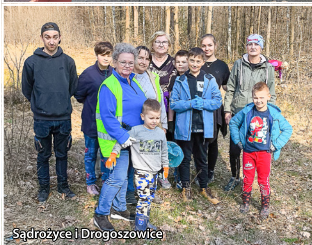
Sądrożyce i Drogoszowice