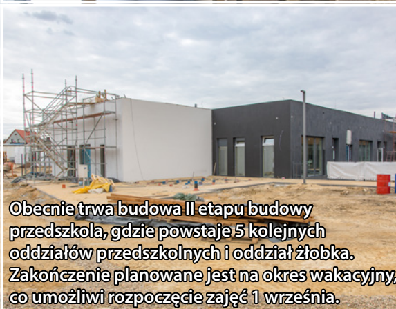
Obecnie trwa budowa II etapu budowy przedszkola, gdzie powstaje 5 kolejnych oddziałów przedszkolnych i oddział żłobka. Zakończenie planowane jest na okres wakacyjny, co umożliwi rozpoczęcie zajęć 1 września.