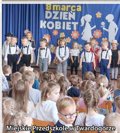
Miejskie Przedszkole w Twardogórze