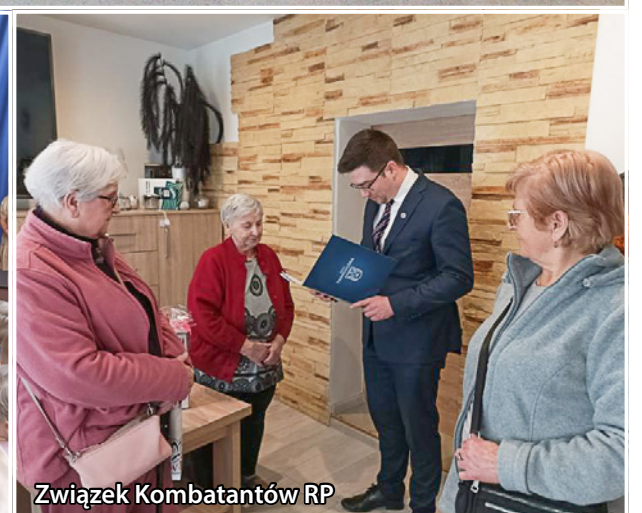
Związek Kombatantów RP