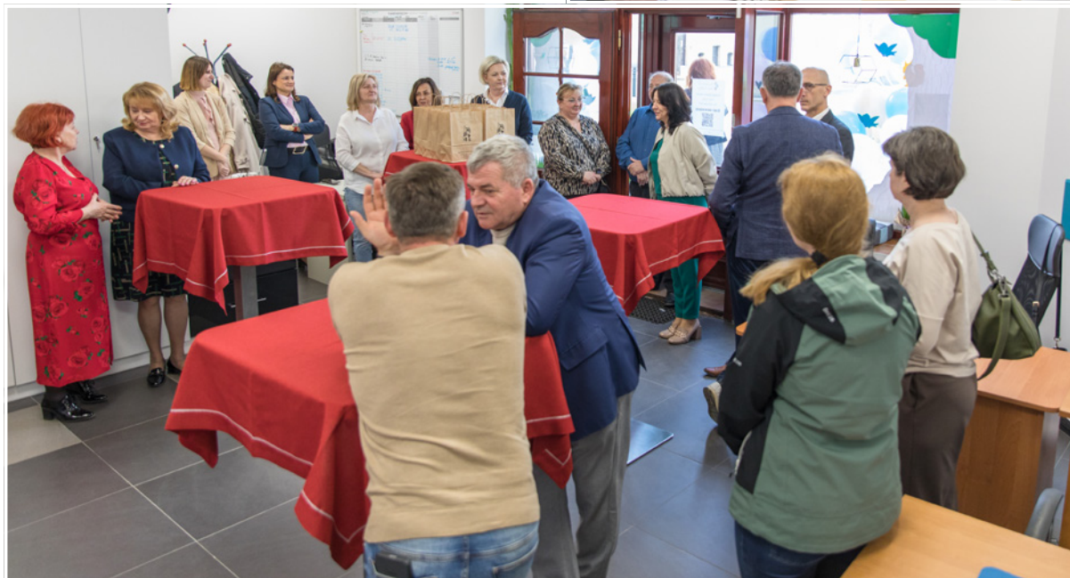
Nowa siedziba znajduje się przy ul. Krótkiej 9