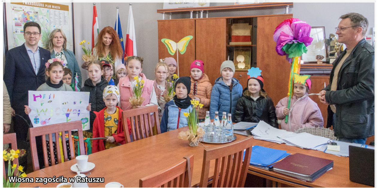
Wiosna zagościła w Ratuszu

Kolorowe stroje, uśmiechy na twarzach i mnóstwo radości – tak wyglądał pierwszy dzień wiosny w gminnych placówkach oświatowych. Tradycyjnie, obchody rozpoczęły się od barwnego pochodu ulicami miejscowości. Przedszkolaki i uczniowie ubrani w kolorowe stroje, z własnoręcznie wykonanymi dekoracjami oraz wiosennymi rekwizytami, maszerowali, śpiewając radosne piosenki. Nie zabrakło także Marzanny, symbolizującej odchodzącą zimą, którą dzieci zgodnie z tradycją pożegnały w wyznaczonym miejscu. Pierwszy dzień wiosny, to nie tylko symboliczne pożegnanie zimy, ale również okazja do integracji i wspólnej zabawy. Wiosna przywitana została z wielką radością i nadzieją na piękne, ciepłe dni!