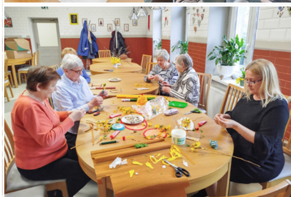
Seniorzy wzięli udział w ciekawych warsztatach