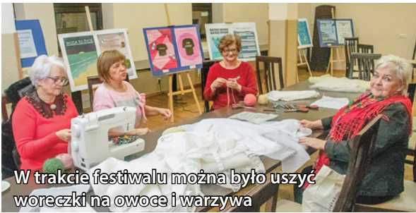
W trakcie festiwalu można było uszyć woreczki na owoce i warzywa

31 stycznia, odbył się Festiwal Drugiego Obiegu. Mieszkańcy mieli okazję wziąć udział w sesji dyskusyjnej na temat zasobów wodnych i ich oszczędzania, warsztatach szycia woreczków na owoce i warzywa oraz tworzenia biżuterii z jeansu, a także wymianie ubrań. Na miejscu można było również obejrzeć wystawę plakatów. Festiwal odbył się w ramach inicjatywy "Kropla przyszłości", która jest częścią projektu Biblioteki dla klimatu realizowanego przez Fundacja FRSI