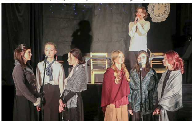
Melodia Wigilijnej Opowieści - uczniowie ZSP