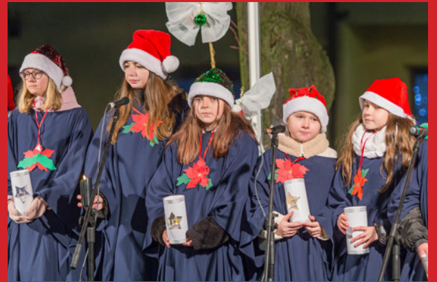
Wydarzenie uświetniły występy dzieci i młodzieży