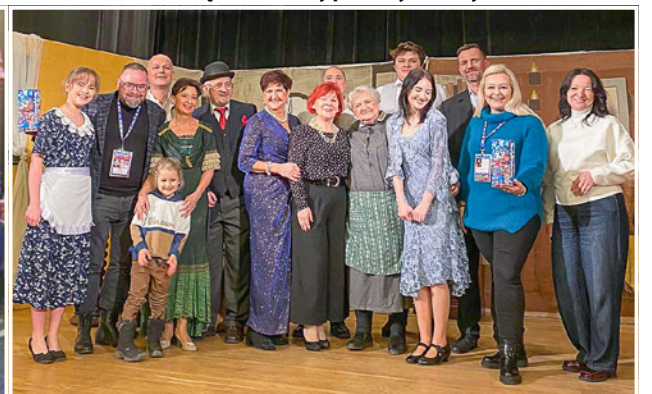
Teatr Poza wystąpił w Goszczu