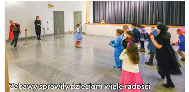
Zabawy sprawiły dzieciom wiele radości

W sali teatralnej Pałacu Goszcz odbył się bal karnawałowy dla dzieci zorganizowany przez Twardogórski Pałac Kultury Centrum Aktywności Społecznej. Tematyka bajkowych postaci sprawiła, że sala zamieniła się w prawdziwą krainę czarów – pełną księżniczek, piratów, wróżek i innych ulubionych bohaterów. Dzieci miały okazję wziąć udział w licznych zabawach i animacjach. Nie zabrakło także muzyki, tańców i oczywiście pysznego poczęstunku, który umilił wszystkim czas.