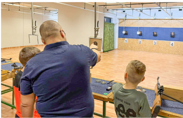
Na strzelnicy pojawiło się blisko 150 osób