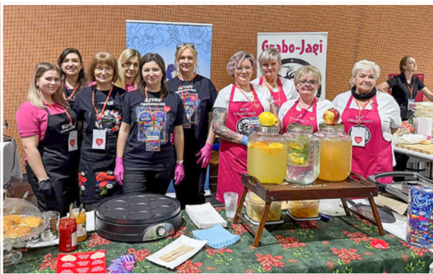
Koła Gospodyń Wiejskich też zagrały z WOŚP