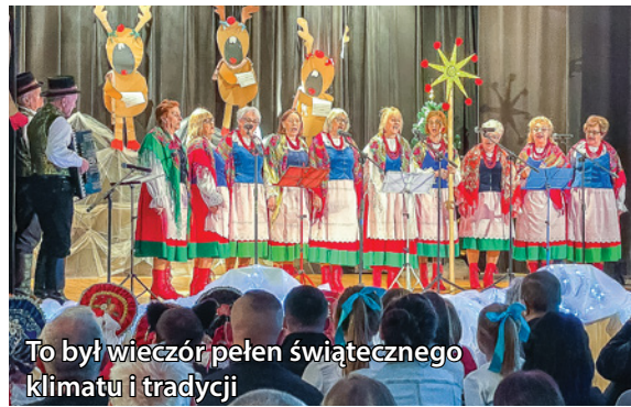
To był wieczór pełen świątecznego klimatu i tradycji

Zespół Skorynianie wystąpił gościnnie w Miejsko-Gminnym Ośrodku Kultury w Międzyborzu podczas koncertu kołęd i pastorałek. Występ zespołu wprowadził publiczność w świąteczny nastrój, przypominając o pięknie polskiej tradycji bożonarodzeniowej. Zgromadzeni widzowie mogli usłyszeć pastorałki, które w wykonaniu Skorynian brzmiały niezwykle klimatycznie.