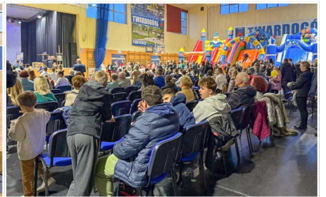
Halę GOSiR wypełniły tłumy