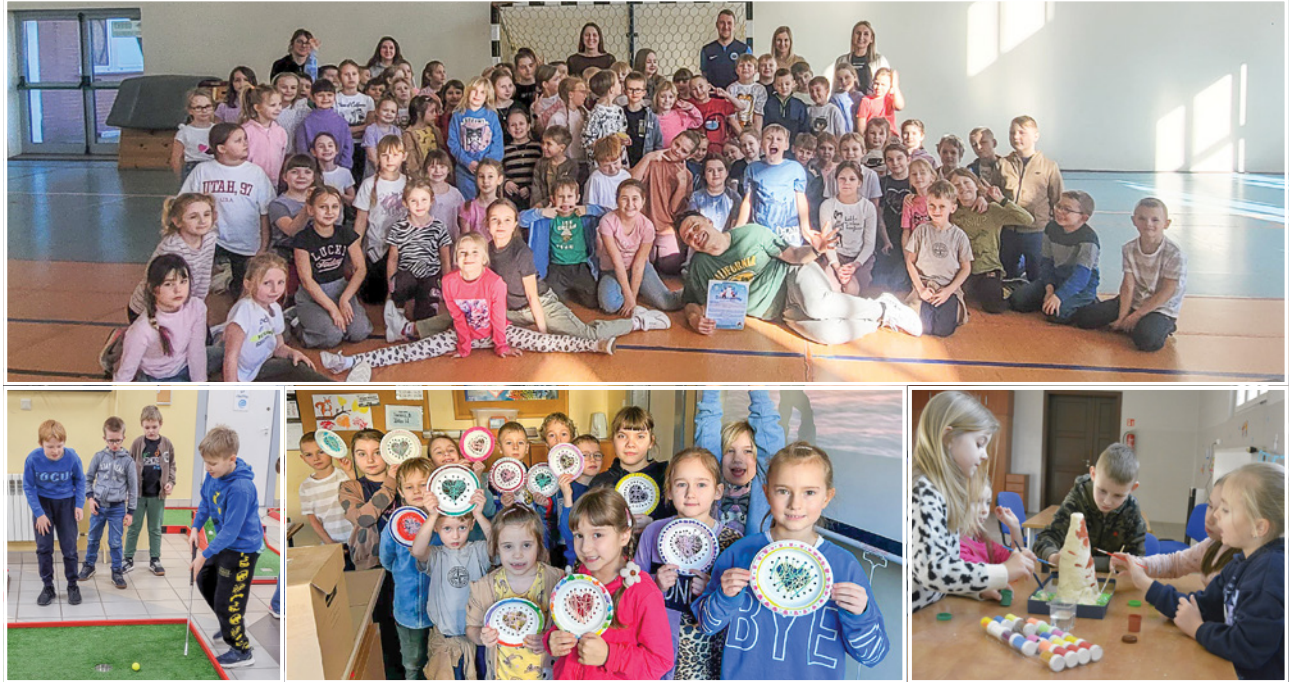
Dzieci wzięły udział m.in. w zajęciach sportowych i plastycznych

Gmina Twardogóra przygotowała niezwykle bogatą ofertę zajęć dla dzieci i młodzieży na czas ferii zimowych. Dzięki różnorodnym aktywnościom nasi mieszkańcy mogli znaleźć coś dla siebie. W programie znalazły się m.in. warsztaty plastyczne, kulinarne, zajęcia literackie, edukacyjne, profilaktyczne i sportowe, projekcja bajki, bezpłatny dmuchany plac zabaw, przedstawienie kabaretowo-edukacyjne, bezpłatne lodowisko i Delfinek, gry, zabawy oraz animacje. Organizatorzy zadbali o to, aby każdy dzień ferii był pełen atrakcji, nauki i dobrej zabawy. Dzięki zaangażowaniu Biblioteki Publicznej, Twardogórskiego Pałacu Kultury Centrum Aktywności Społecznej, Gminnego Ośrodka Sportu i Rekreacji w Twardogórze, Oratorium św. Dominika Savio w Twardogórze, Stowarzyszenia Tu i Teraz, Młodzieżowej Rady Gminy Twardogóra ferie w Twardogórze stały się wyjątkowym czasem integracji i rozwijania pasji dla najmłodszych mieszkańców gminy.