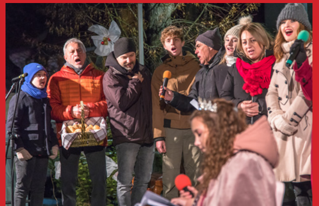
Na scenie zaprezentowały się przedszkolaki, Zespół Skorynianie oraz aktorzy musicalu ELZA