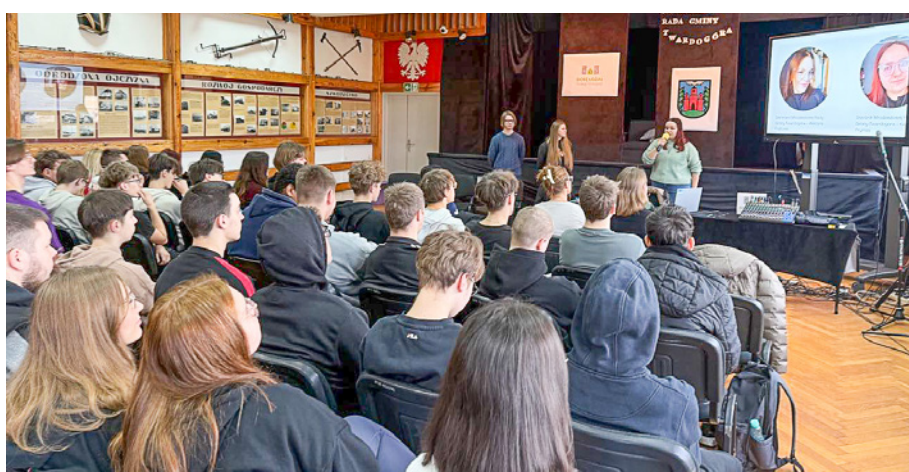
Radni spotkali się z młodzieżą w Twardogórze, Goszczu i Grabownie Wielkim