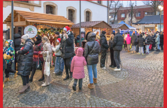
Na Jarmarku gościliśmy blisko 40 wystawców