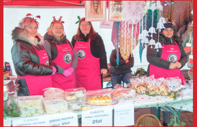
Koła Gospodyń Wiejskich z Grabowna Małego, Olszówki i Grabowna Wielkiego zapraszały na swoje stoiska