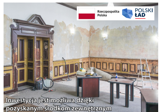
Inwestycja jest możliwa dzięki pozyskanym środkom zewnętrznym

Trwa modernizacja sali posiedzeń w budynku Ratusza – miejsca, w którym obraduje Rada Miejska w Twardogórze, odbywają się lekcje samorządności oraz konsultacje społeczne. Zakres prac obejmuje m.in.: cyklinowanie i lakierowanie parkietu, czyszczenie i malowanie drewnianej lamperii, portalu wejściowego, drzwi oraz gzymsów drewnianych pod sufitem, malowanie ścian i sufitu, wykonanie instalacji elektrycznej i teletechnicznej, montaż kotar umożliwiających zasłonięcie całych okien, montaż rozwijanego ekranu i opraw oświetleniowych, zakup i montaż grzejników, wykonanie kanału technologicznego, montaż uchwyty na godło, herb, kamery i głośniki. Koszt realizowanej inwestycji wyniesie 173 000 zł. Gmina Twardogóra pozyskała na to zadanie dofinansowanie w wysokości 150 000 zł z Rządowego Programu Odbudowy Zabytków.