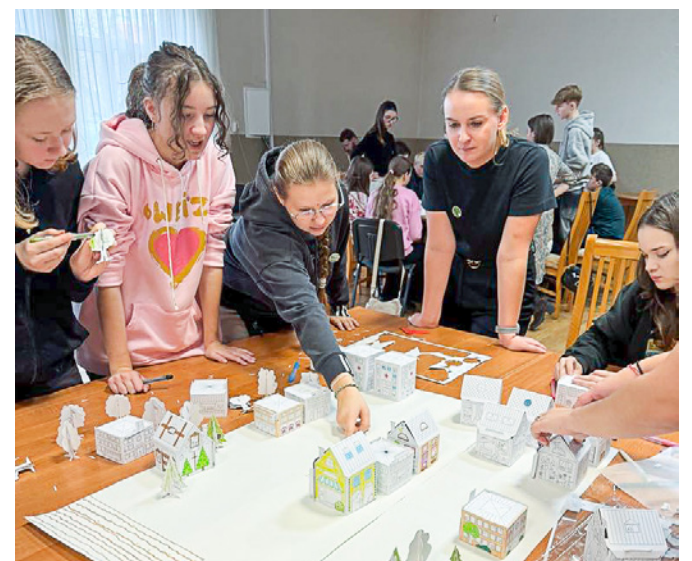
Dzięki takim spotkaniom młodzież może lepiej rozumieć mechanizmy działania samorządów młodzieżowych oraz aktywniej angażować się w życie społeczne

cyjatywami oraz sposobami na zwiększenie zaangażowania młodzieży w życie publiczne. Wydarzenie zostało sfinansowane ze środków Narodowego Instytutu Wolności – Centrum Rozwoju Społeczeństwa Obywatelskiego w ramach Rządowego Programu Fundusz Młodzieżowy na lata 2022-2033, edycja 2024. Przyznana kwota dotacji wyniosła 205 674,08 zł.