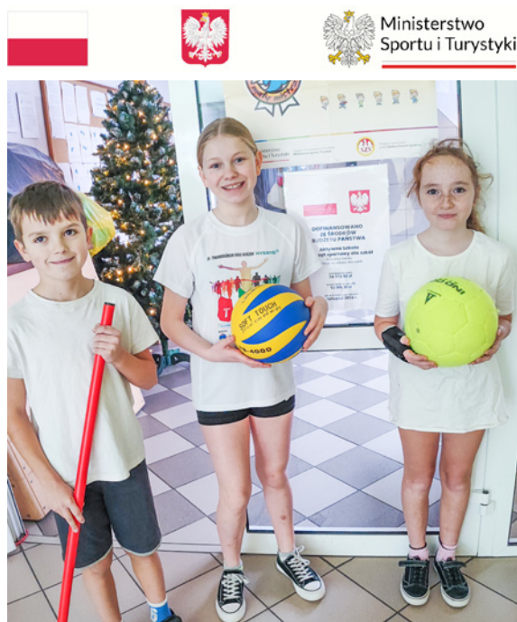
Dzięki tej inicjatywie uczniowie mają jeszcze lepsze warunki do aktywnego spędzania czasu i rozwijania swoich umiejętności sportowych

Wkład własny w wysokości 18 583,39 zł został wniesiony w formie niefinansowej. Zakupiono m.in. piłkochwyty, rakiety do badmintonu i tenisa stołowego, hula hoop, piłki, ławeczki gimnastyczne, stół do tenisa stołowego, piłkarzyki, szarfy gimnastyczne, maty fitness, worek bokserski dla dzieci, kije do unihokeya. Dzięki tej inicjatywie uczniowie mają jeszcze lepsze warunki do aktywnego spędzania czasu i rozwijania swoich umiejętności sportowych.