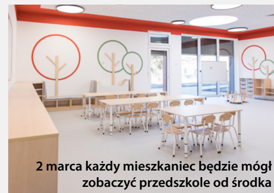
2 marca każdy mieszkaniec będzie mógł zobaczyć przedszkole od środka

Podczas Dnia Otwartego mieszkańcy będą mogli zwiedzić wnętrza przedszkola, w tym przestronne sale dydaktyczne, atrium, salę gimnastyczną, jadalnię oraz zobaczyć nowoczesne wyposażenie placówki. W programie nie zabraknie występów przedszkolaków, zabaw, animacji oraz dmuchańców. Będzie to doskonała okazja dla rodziców i dzieci, aby dowiedzieć się jak wygląda przedszkole i jakie możliwości edukacyjne oferuje najmłodszym mieszkańcom naszej gminy.