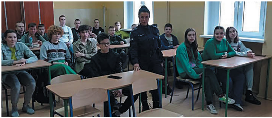
Cenna lekcja o przestrzeganiu prawa

świata na jakie narażona jest dzisiejsza młodzież oraz odpowiedzialność karna jaką ponoszą nastolatki za złamanie prawa.