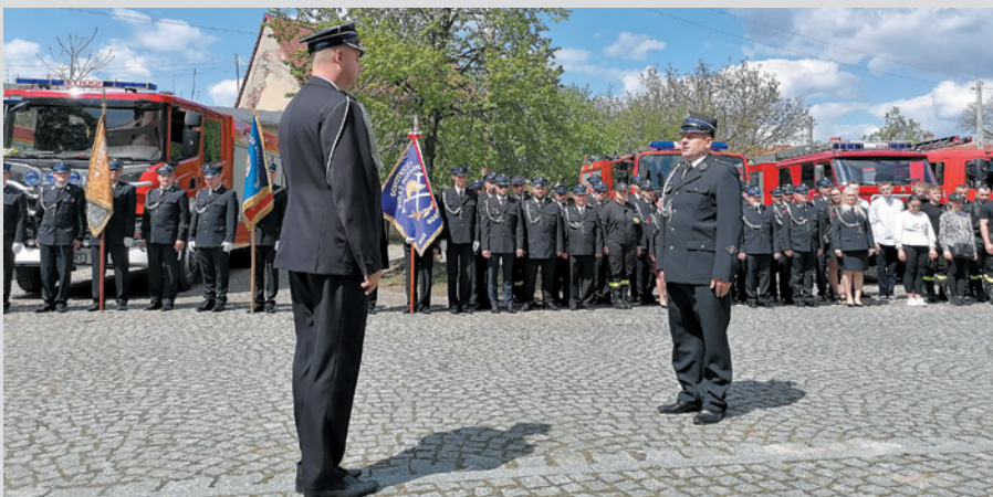
W uroczystości brały udział wszystkie gminne jednostki OSP