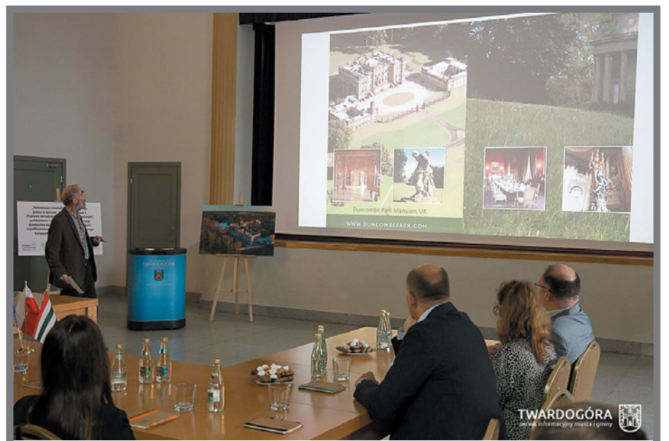
W trakcie konferencji rozmawiano o pracach restauratorskich przy zabytkach w Anglii i Norwegii. Porównywano je do tych, które są obecnie przeprowadzane w Goszczu