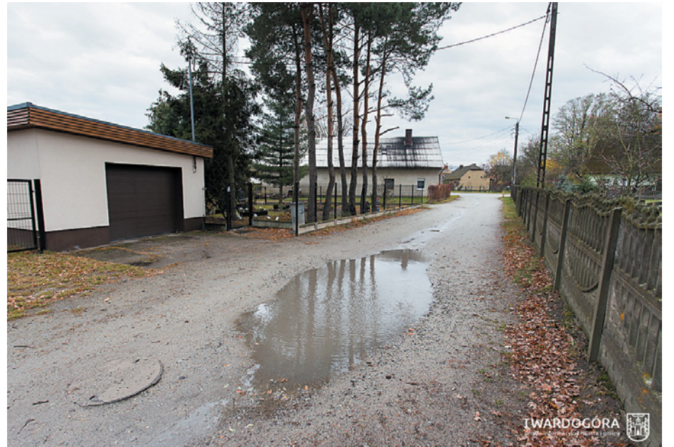
Ulica J. Słowackiego w Goszczu