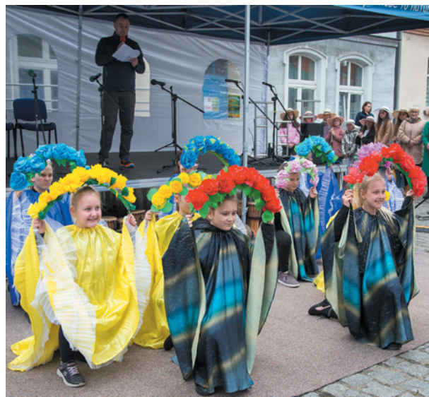
Część artystyczna w wykonaniu uczniów gminnych szkół