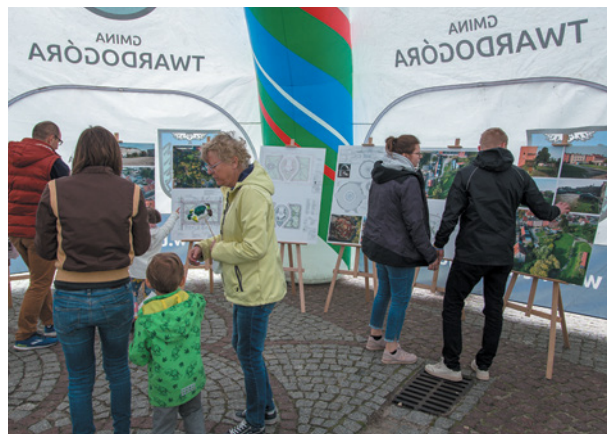
Mieszkańcy mogli zapoznać się z koncepcją podwórzy i parku przy Bazylice Mniejszej