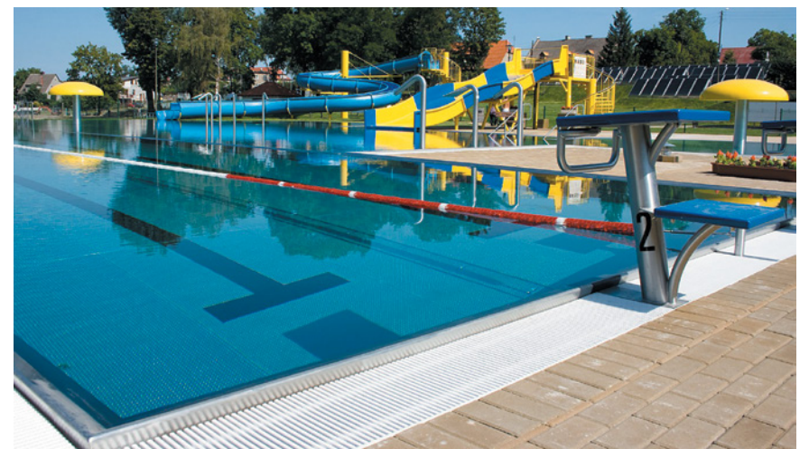
Miejskie kąpielisko to idealne miejsce na letni wypoczynek