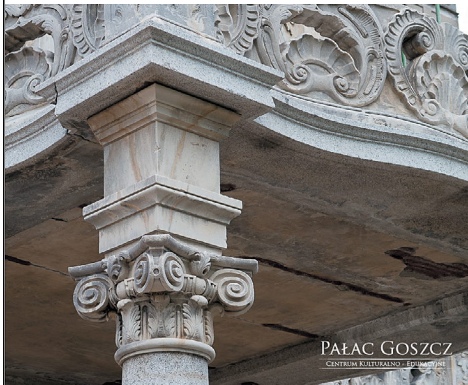
Trwają prace nad przywróceniem detali do dawnego piękna

Na terenie pałacu w Goszczu trwają prace budowlane. Obecnie zabezpieczone są detale, odbywają się prace na koronach murów oraz konsultowane są z konserwatorem zabytków rozwiązania dotyczące zabezpieczenia posadzek.