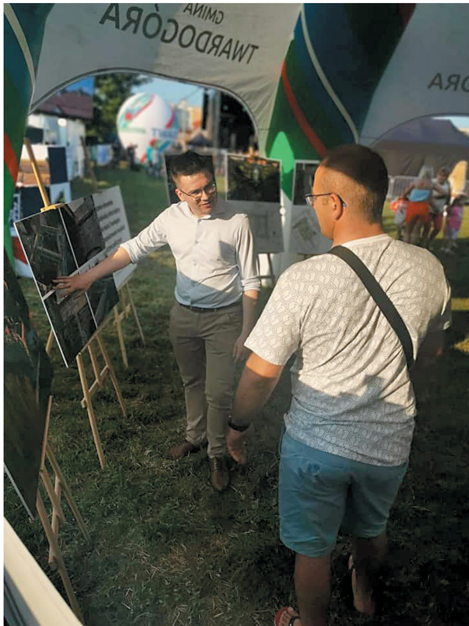
W trakcie Dni Twardogóry rozmawialiśmy m.in. o realizowanych inwestycjach