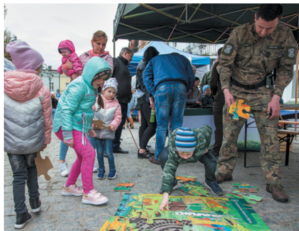
Ekopiknik to także sporo atrakcji dla dzieci