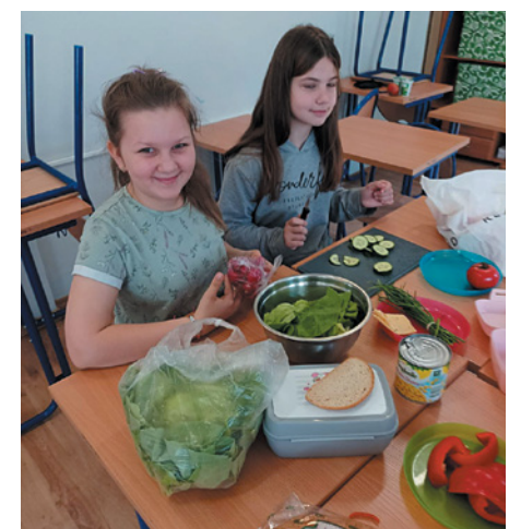
Europejski Dzień Śniadania w Grabownie Wielkim

Wszyscy staramy się pamiętać, że śniadanie to najważniejszy posiłek dnia, który dostarcza niezbędnej energii, by móc się uczyć i rozwijać. 24 kwietnia społeczność szkolna obchodziła Europejski Dzień Śniadania. Wiele klas wraz z wychowawcami przygotowało zdrowe i pyszne kanapki, poszerzyło swoją wiedzę na temat zbilansowanych posiłków, a wszystkim towarzyszyły przyjemne emocje i zabawa.