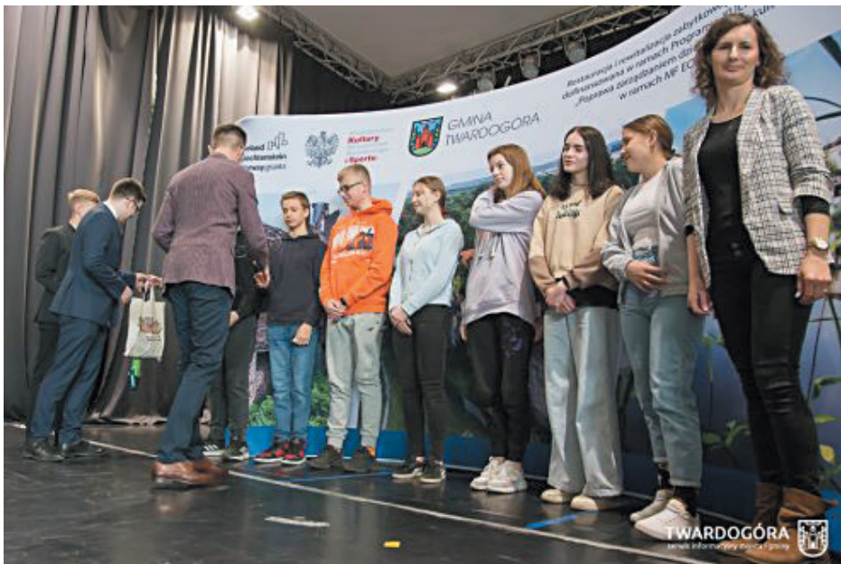
SP w Goszczu

tonowych, o studiach na Politechnice Wrocławskiej, a ponadto odważnie wykorzystali zdobytą wiedzę do realizacji nowych, odkrywczych działań. Współpraca z Politechniką Wrocławską jest związana z realizacją projektu pn. „Restauracja i rewitalizacja zabytkowego pałacu w Goszczu” w ramach w ramach działania 1. „Poprawa zarządzania dziedzictwem kulturowym”, poddziałania 1.1. „Restauracja i rewitalizacja dziedzictwa kulturowego” Programu „Kultura”, współfinansowanego z Mechanizmu Finansowego Europejskiego Obszaru Gospodarczego na lata 2014-2021. Przedmiotem porozumienia z Politechniką – oprócz warsztatów - będą również spotkania naukowe i publikacje, nawiązujące do budynków i budowli Gminy Twardogóra.