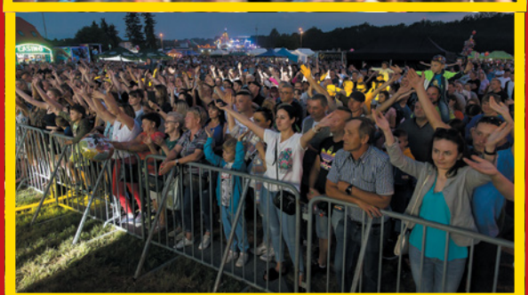
W niedzielę, po południu przy ul. M. Kopernika przygotowano blok zabaw i atrakcji dla dzieci z miasteczkiem cyrkowym, stoiskiem misyjnym i rodzinnym widowiskiem Bill Bombadill Show.