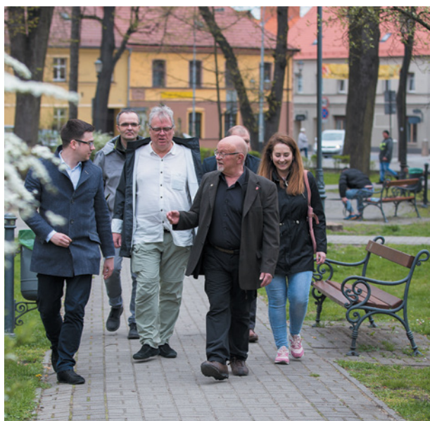
Norwegowie konsultowali przyjęte rozwiązania