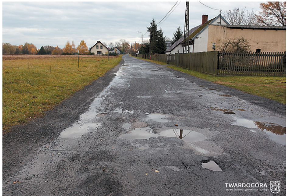
Droga w Drągowie wymaga remontu

gowie – w pełnym zakresie tj. od drogi powiatowej na lewo w kierunku Nowej Wsi Goszczańskiej, a także w kierunku Goszcza k. przystanku autobusowego. Inwestycje dofinansowano w kwocie 10,3 mln zł w ramach Rządowego Funduszu Polski Ład: Program Inwestycji Strategicznych. Pozostałe środki zostały zabezpieczone w budżecie Gminy Twardogóra.