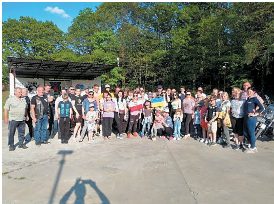
Chętnych do prac było wielu

w Twardogórze. Grabieniem liści, oczyszczaniem rabat z chwastów czy zbieraniem śmieci zajęli się nie tylko dorośli ale i dzieci.