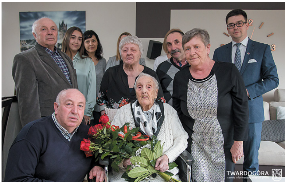
To była wspaniała uroczystość