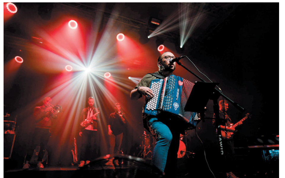
Zespół wystąpił w Twardogórze po raz pierwszy

te Ręce, Zbudujemy Dom czy Kamień z Napisem Love. Publiczność z chęcią śpiewała znane kawałki, a niektórych nawet poderwało do tańca!