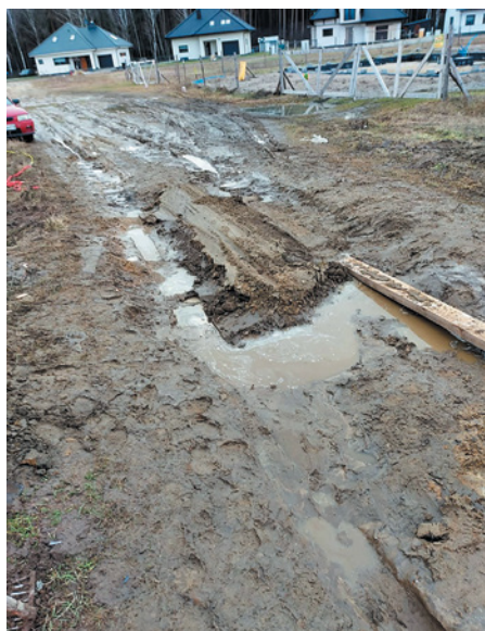
Ulica Rubinowa w Goszczu