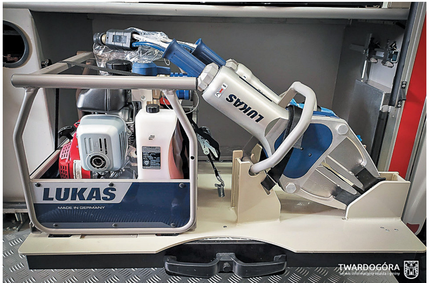
Zakup sprzętu hydraulicznego do ratownictwa drogowego to projekt, który uzyskał największą liczbę głosów

Wzór deklaracji jest dostępny na stronie gunb.gov.pl . Druk deklaracji można również pobrać w Urzędzie Miasta i Gminy w Twardogórze pok. nr 3. Szczegółowe informacje można uzyskać pod numerem telefonu: 71 399 22 39 UMiG w Twardogórze.