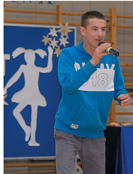
W rywalizacji mógł wziąć udział każdy uczeń szkoły, od klasy 0 do 8.

Rada Rodziców i nauczyciele szkoły przygotowali dla uczniów możliwość zaprezentowania swoich talentów w wielu kategoriach. 1 kwietnia,