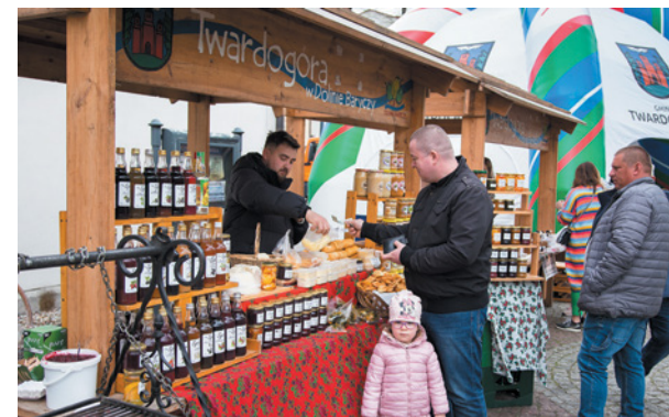
Na stoiskach pojawiły się lokalne produkty i przetwory