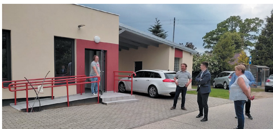
W czerwcu odbył się odbiór częściowy prac

W maju nastąpił odbiór robót konstrukcyjnych. Kolejne etapy to elewacja, montaż urządzeń dźwigowych i prace wykończeniowe.