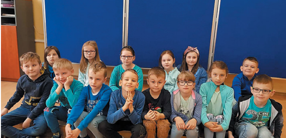
Uczniowie okazali solidarność z osobami chorującymi na autyzm

2 kwietnia na całym świecie obchodzony jest Światowy Dzień Świadomości Autyzmu. W tym dniu nauczyciele oraz uczniowie w geście solidarności z osobami zmagającymi się z tą chorobą założyli na siebie coś niebieskiego.