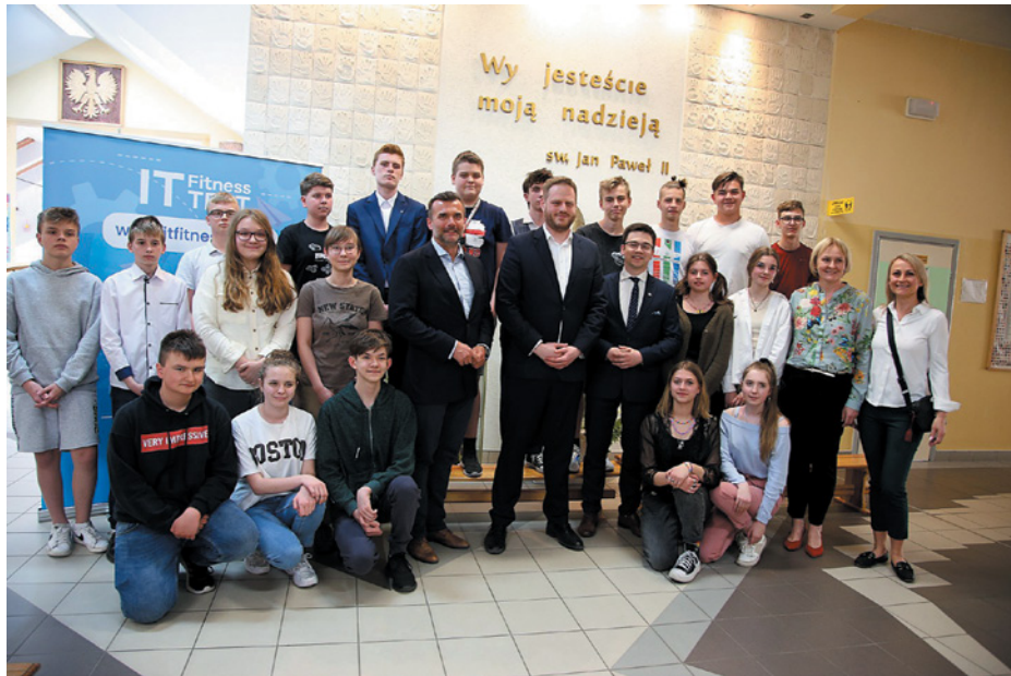
Nasi uczniowie uzyskali bardzo dobry wynik

Uczniowie ze Szkoły Podstawowej nr 2 im. Jana Pawła II w Twardogórze, Szkoły Podstawowej w Goszczu i Szkoły Podstawowej w Grabownie Wielkim przystąpili do międzynarodowego IT Fitness Test 2022 Grupy Wyszehradzkiej. 12 maja wzięli udział w lekcji pokazowej, na której rozwiązywali test, który ma na celu zbadanie poziomu kompetencji IT wśród uczniów w obszarach ta-