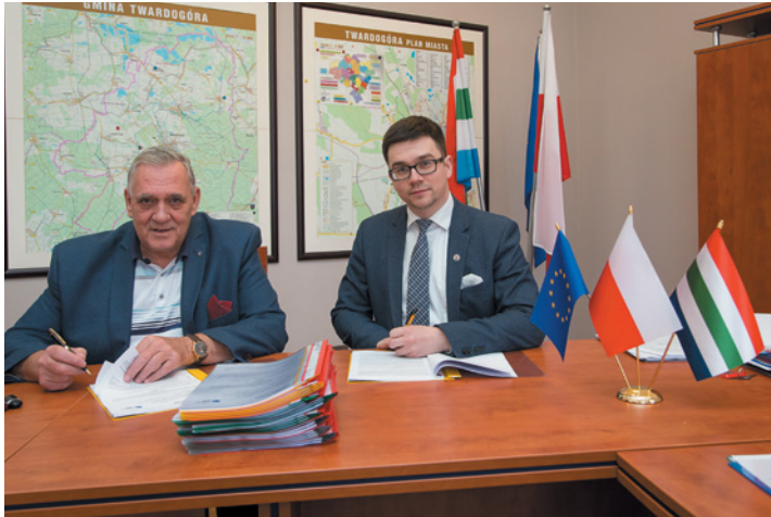
Podpisanie umowy na realizację inwestycji

- przebudowę i remont dwóch dróg w Moszycach tj. od krzyża do świetlicy środowiskowej i odcinek od drogi wojewódzkiej w kierunku Wesółki, - remont oraz przebudowę drogi w Drą-