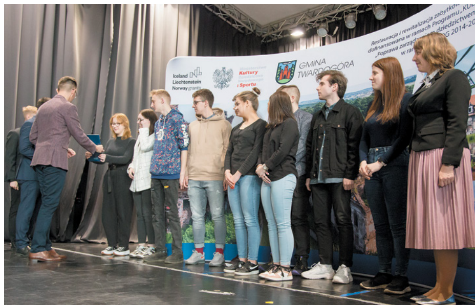
ZSP w Twardogórze