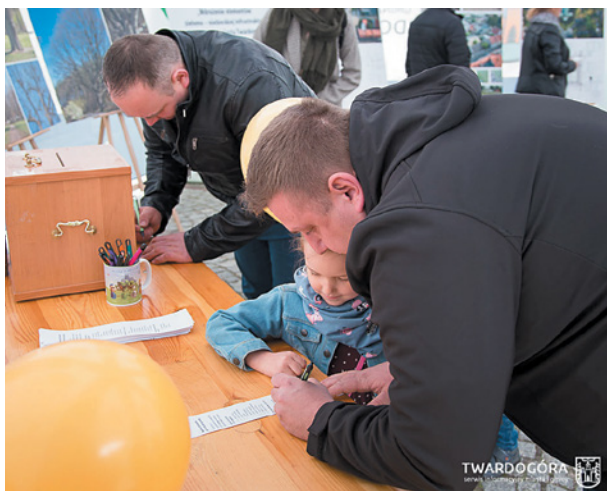
Konsultacje w sprawie nazw dla pomników przyrody