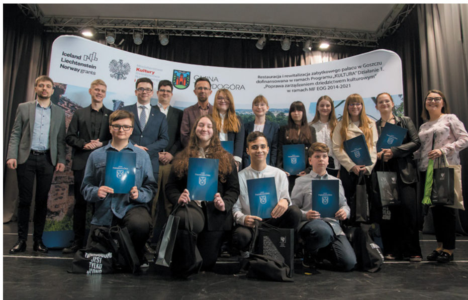
SP2 w Twardogórze