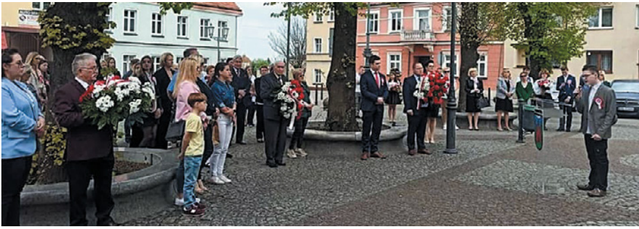
Obchody miały charakter symboliczny

pod pamiątkową tablicą złożyli przedstawiciele władz samorządowych Gminy Twardogóra oraz nasi mieszkańcy.