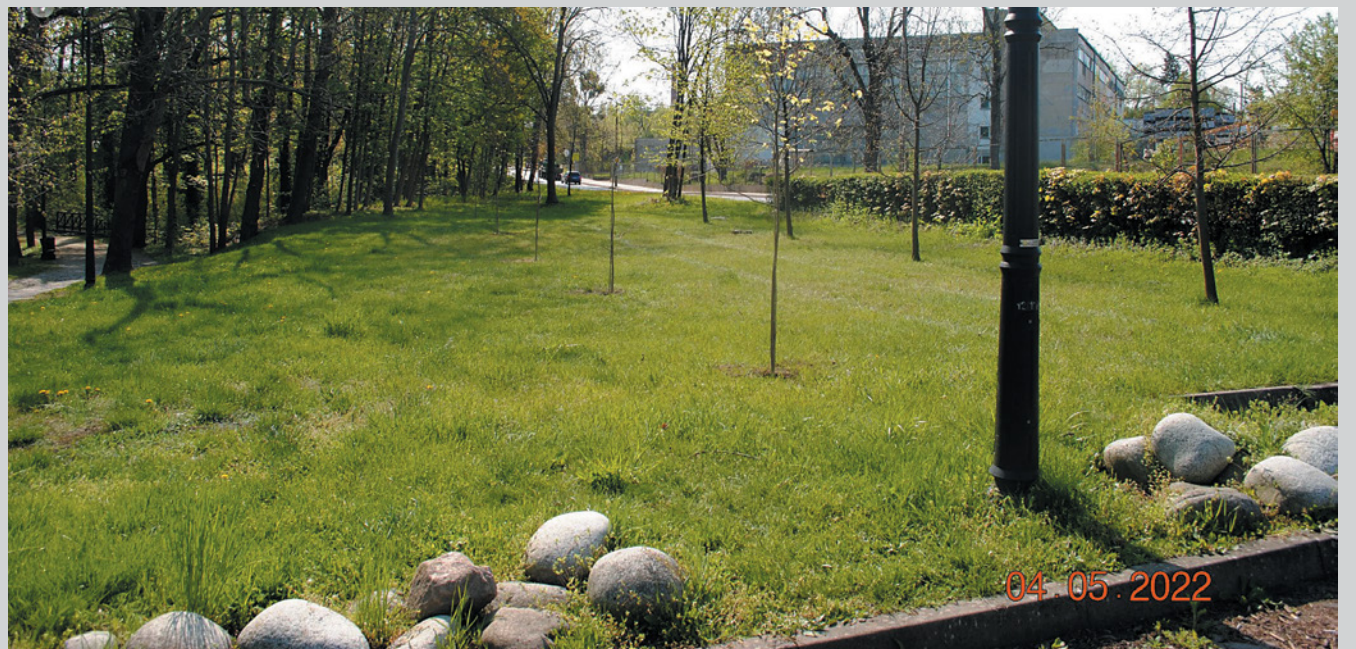
Podczas wiosennych nasadzeń w Twardogórze, Dąbrowie, Drogoszowicach i Grabowni Wielkim posadzono m.in. klon, głogi, lipy, kasztany i brzozy. Łącznie przybyło 100 nowych drzew!

Zasady i tryby realizacji Twardogórskiego Budżetu Obywatelskiego zostały określone w uchwale nr XLIX.412.2022 Rady Miejskiej w Twardogórze z dnia 28 kwietnia 2022r. w sprawie Twardogórskiego Budżetu Obywatelskiego dostępnej na stronie www.twardogora.pl . Na stronie internetowej są dostępne do pobrania także: formularz zgłoszeniowy i lista osób popierających projekt. Szczegółowe informacje dotyczące wypełnienia formularzy zgłoszeniowych można uzyskać w pok. nr 6 UMiG w Twardogórze lub pod nr telefonu: 71 399 22 25.